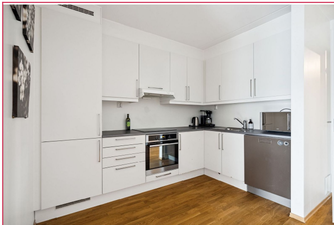
Kjøkken med alle hvitevarer