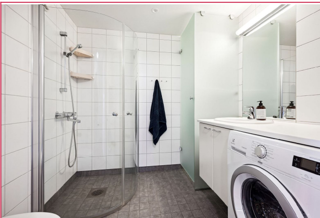
Bad med vaskemaskin