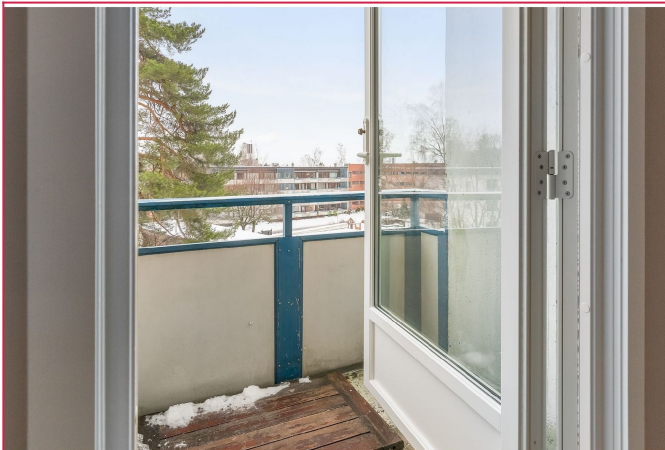
Balkong med utsikt