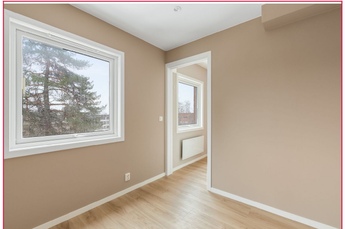
Utgang til kjøkken fra soverom