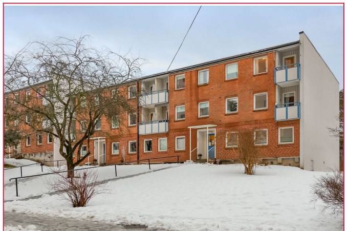
Fasade til Folke Bernadottes vei 5 A