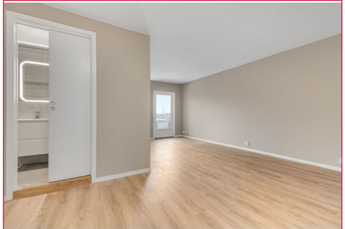
Leiligheten er totalrenovert i 2021 og holder en god standard