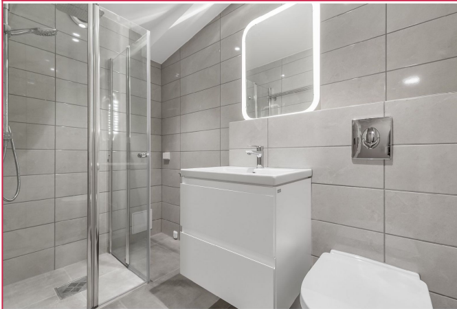
Lekker flislagt bad med varmekabler i gulv og opplegg til vaskemaskin