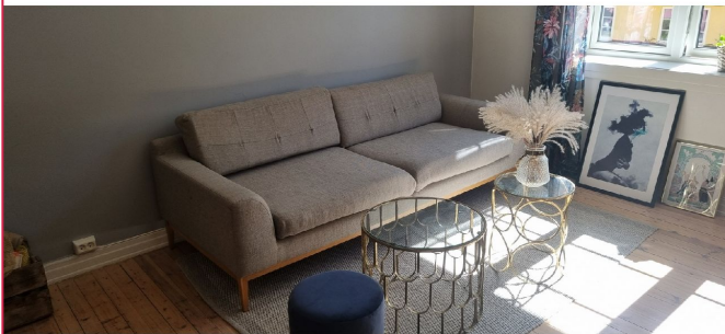
Møblene på bildene medfølger, TV er ikke inkludert.