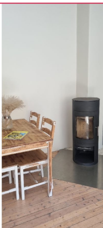
Peis som gir god varme på vinteren