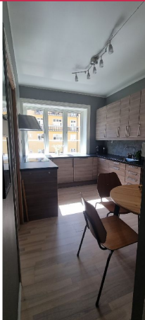
Stort kjøkken med mye oppbevaringsplass