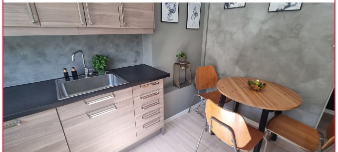
Spisebord og stoler medfølger leiligheten