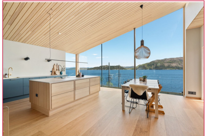
Nydelig utsikt fra stue og kjøkken