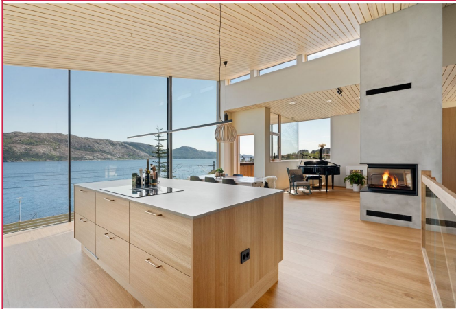
Kjøkken og stue i åpen løsning