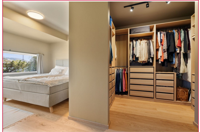
Hovedsoverom med walk-in-closet