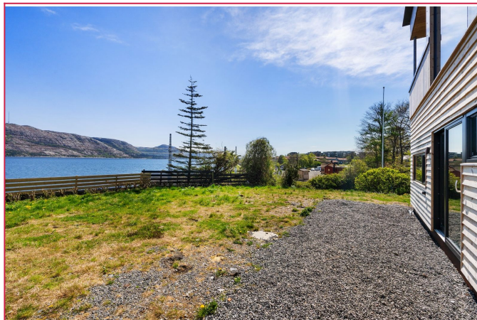
Uteområde- Her vil det komme plen før overtakelse.