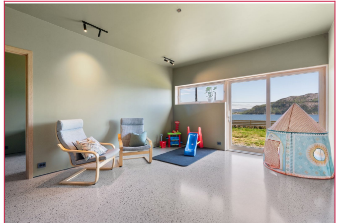
Stue i 1 etasje