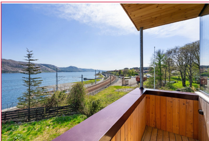
Balkong fra stue