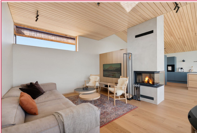
Stue med vedovn