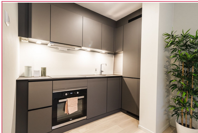
Fint kjøkken med integrerte hvitevarer.