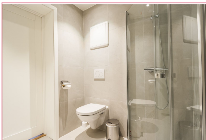
Lyst, flislagt bad med varmekabler og opplegg til vaskemaskin.