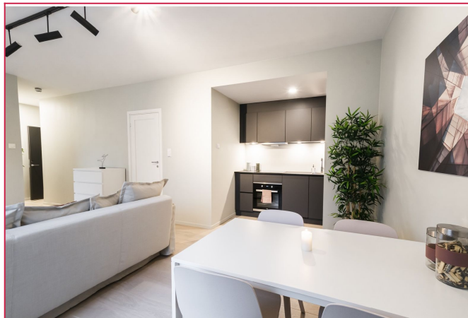
Romslig stue med plass til sofa og tilhørende møblement. Oppvarming er inkludert i husleien.