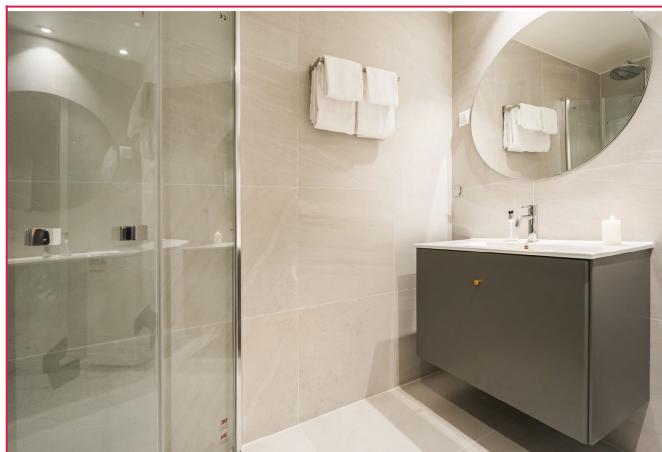
Lyst, flislagt bad med varmekabler og opplegg til vaskemaskin.