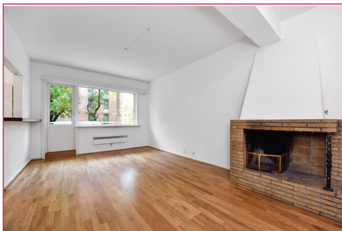
Stue med peis - leiligheten er møblert, men fremkommer ikke på bildene

SAKSNUMMER 49492 - PARKVEIEN 80, 0254 OSLO