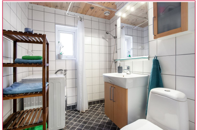
Flislagt bad med vaskemaskin.