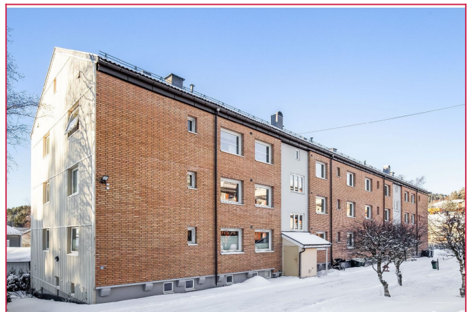
Velkommen til Dugnadsveien 11A!