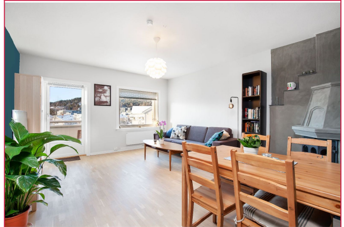
Stue med utgang til balkong.