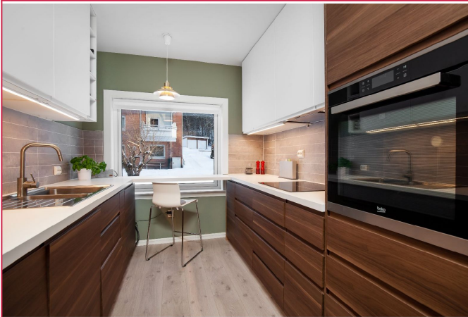
Kjøkkenen med integrert hvitevarer.