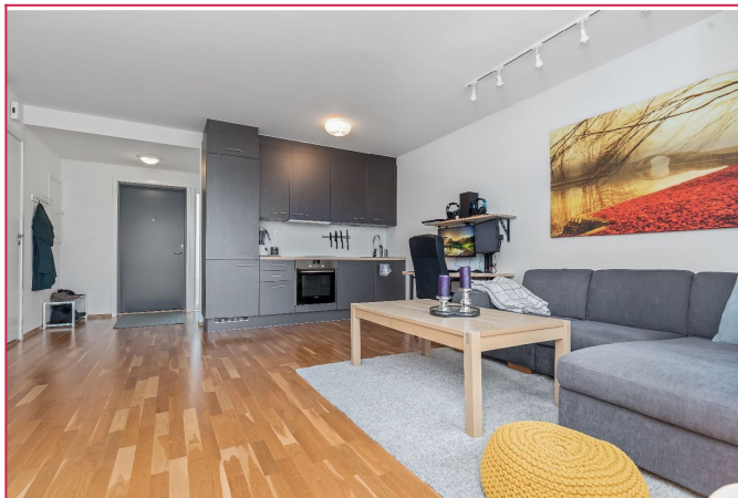
Stuen er lys og trivelig med god plass til sofagruppe, spisebord, samt ytterligere møbleringer