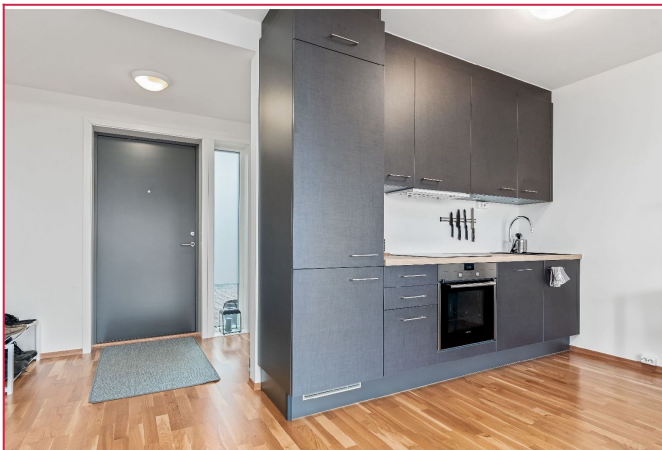
Pent kjøkken med integrerte hvitevarer