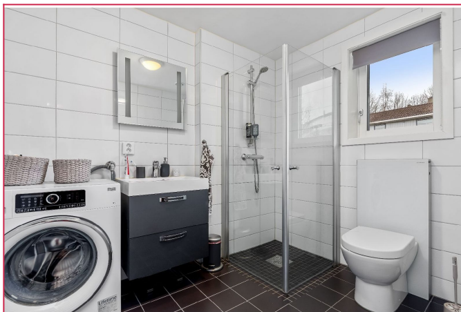
Pent flislagt bad med varmekabler i gulv