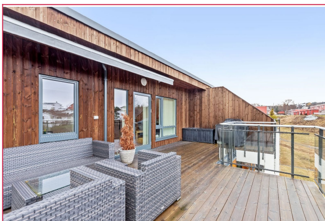
Stor balkong med svært gode solforhold