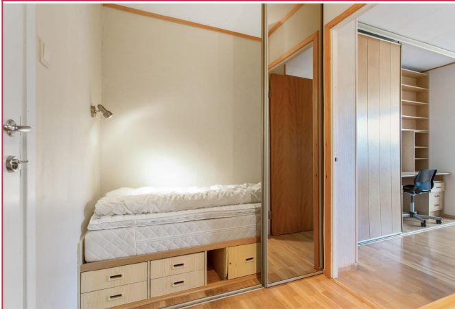
Sovealkove med skyvedører