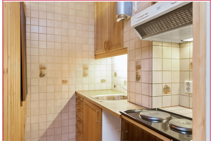
Praktisk kjøkkenkrok med hybelkomfyr, mikro og kombiskap