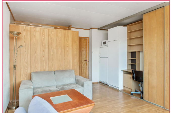
Mange praktisk løsninger i denne leiligheten