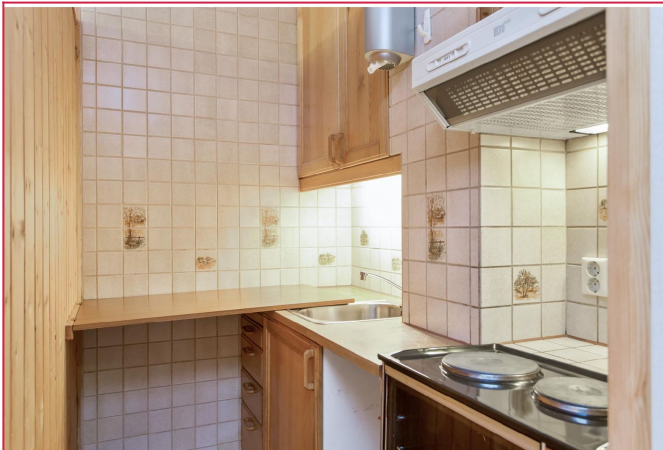
Praktisk løsning med nedfellbar benkeplass