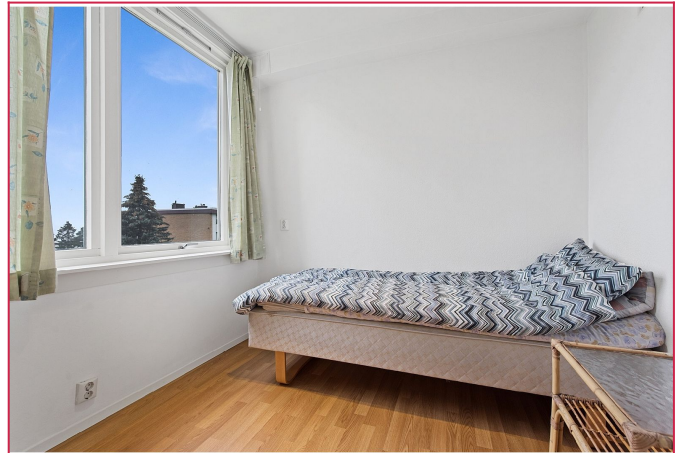
Soverom nummer 2.