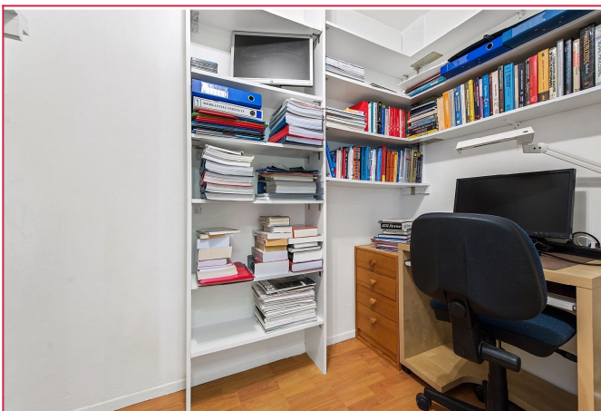
Walk in garderobe/ kontor