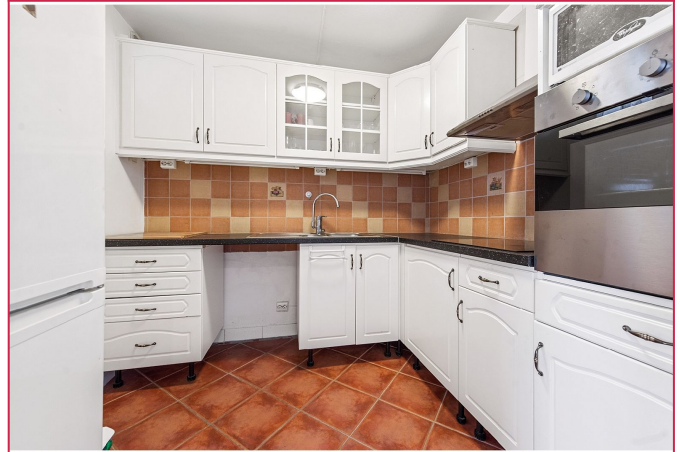
Romslig kjøkken med medfølgende hvitevarer.