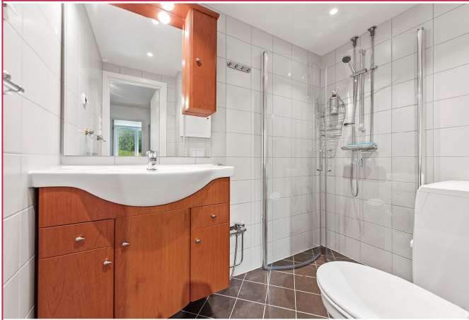
Nyere, flislagt bad med varme i gulv.