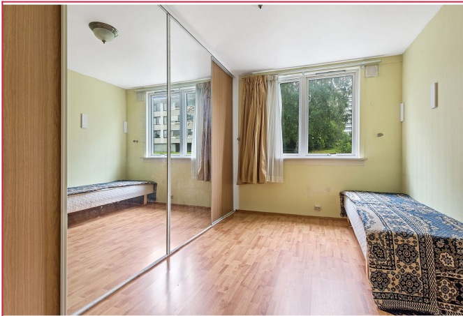
Soverom med skyvedørgarderobe.