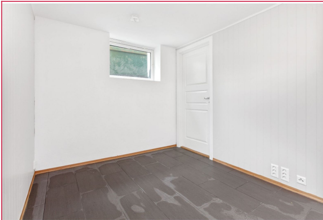
Oppholdsrom (stuedel) ca 10,5 kvm.