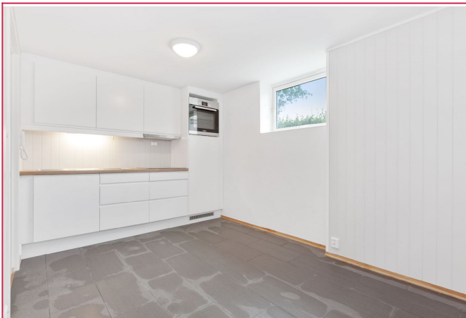
Oppholdsrom med nyere kvalitetskjøkken fra Epoq.