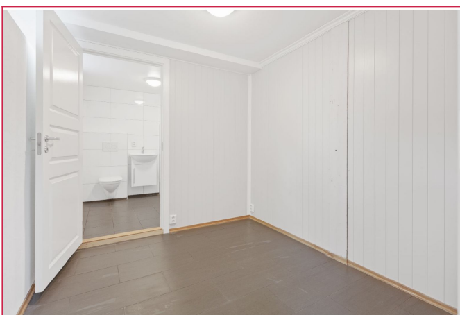
Sovealkove på ca 6 kvm. Direkte inngang videre til leilighetens bad.