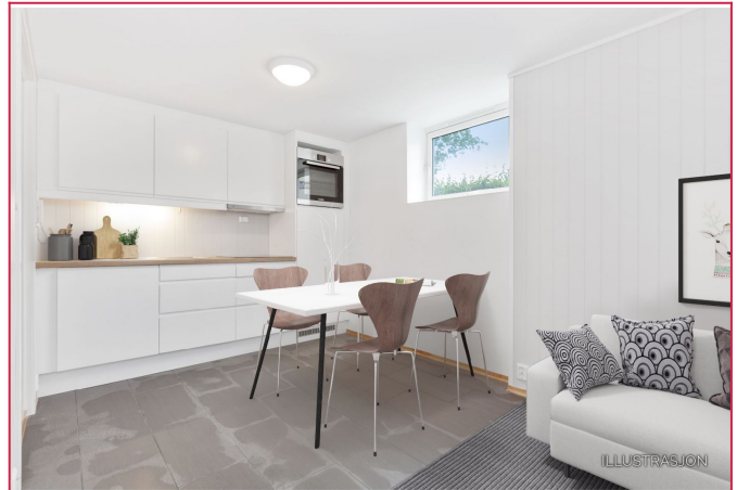
Plass til lite spisebord ved kjøkkendelen (digitalt møblert bilde)