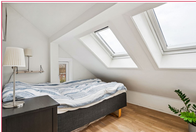
Lyst soverom med plass til dobbeltseng

SAKSNUMMER 38817 - SETERVEIEN 5 C, 1162 OSLO