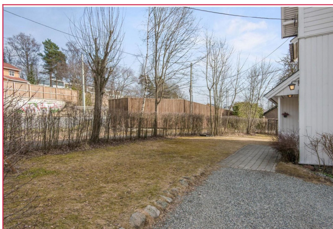
Egen hageflekk med plass til utemøblement og grill