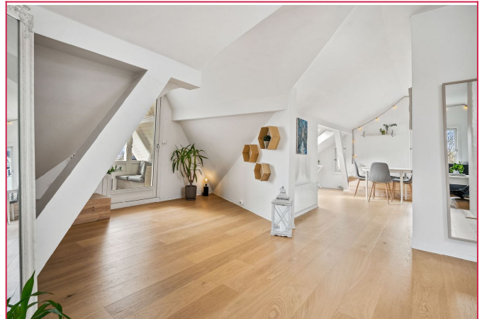
Gulvareal på 57 kvm!