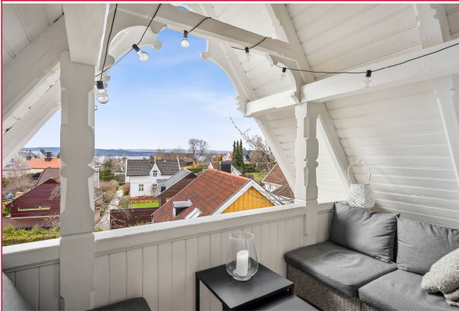
Balkong med flott utsikt