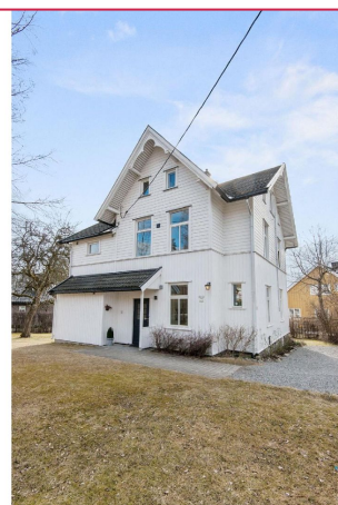
Loftleilighet i Sveitervilla