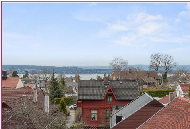
Fantastisk utsikt fra leiligheten