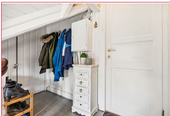
Plass til oppheng av klær og sko utenfor