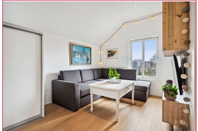
Innbydende stue med gode møbleringsmuligheter