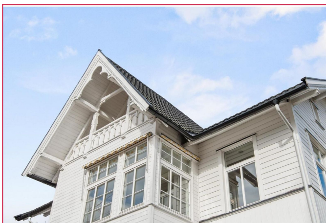
Loftsleilighet med balkong