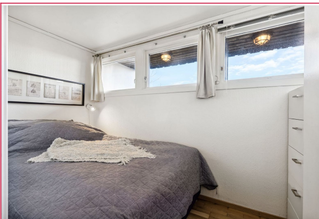
Soverom med seng.