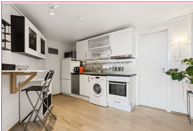
Enkelt kjøkken med hvitevarer.