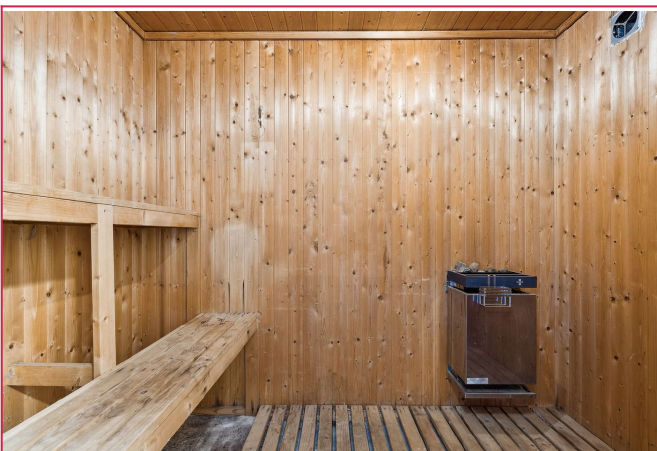
Fra bad finner vi også badstue. Denne kan også brukes til bod for oppbevaring.