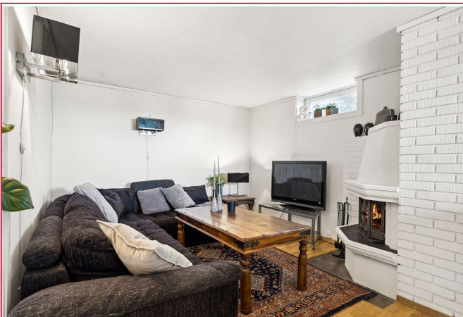
Stue med sofagruppe og peis.