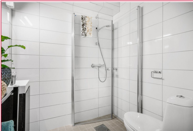
Badet er helfliset og har varmekabler i gulv