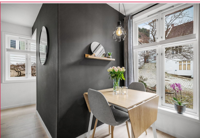
Sittegruppe med utsikt over nærområdet