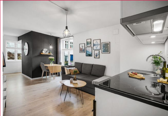
Leiligheten leies ut møblert