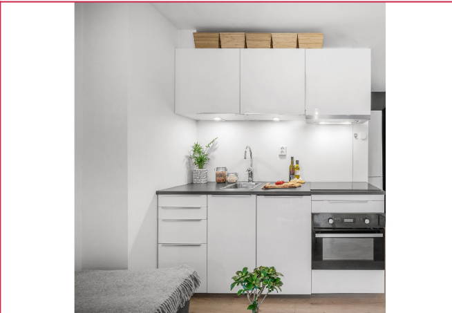
Kjøkkenet inneholder oppvaskemaskin, steketopp og komfyr