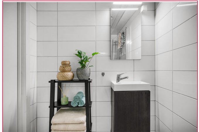
Felles vaskerom i bygget