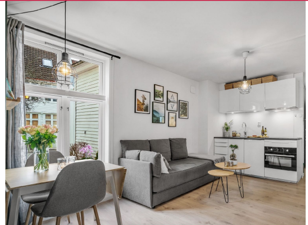
Store vindusflater som sørger for naturlig lysinnslipp