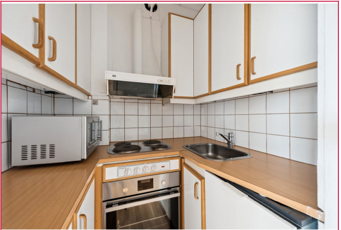
Kjøkken med hvitevarer og flislagt vegg.