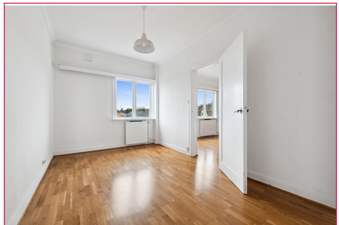
Soverom med plass til dobbelseng og garderobe.