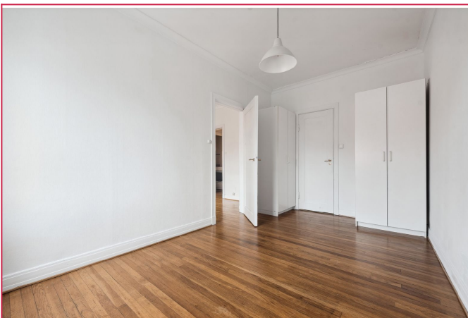
Soverom med garderobe inkludert.