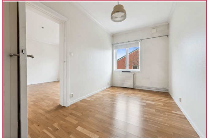
Soverom med plass til dobbelseng.