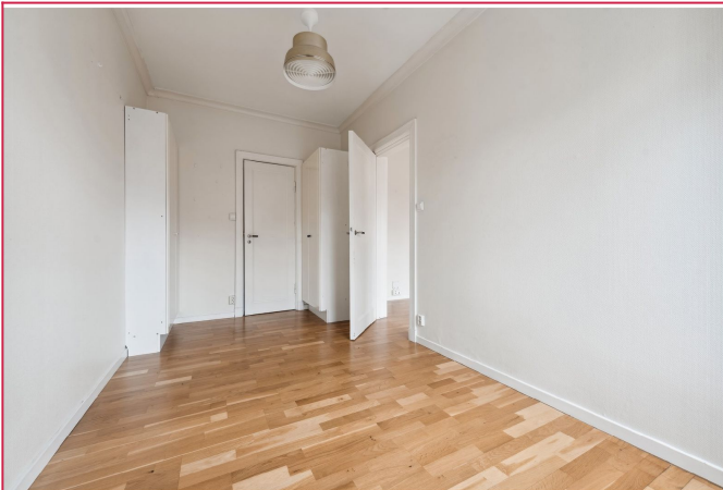
Soverom har garderobe inkludert.