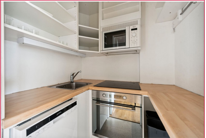
Kjøkken med hvitevarer.