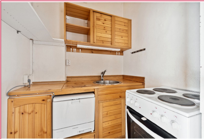
Kjøkken med hvitevarer.