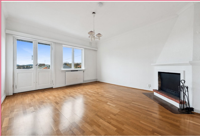
2-roms leiligheter med romslige stuer. Leilighetene er relativt like, plassert i ulike etasjer.