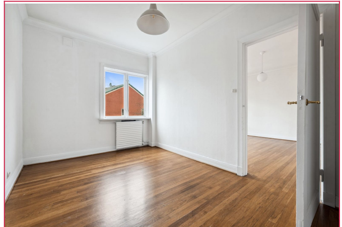
Soverom med plass til dobbeltseng.