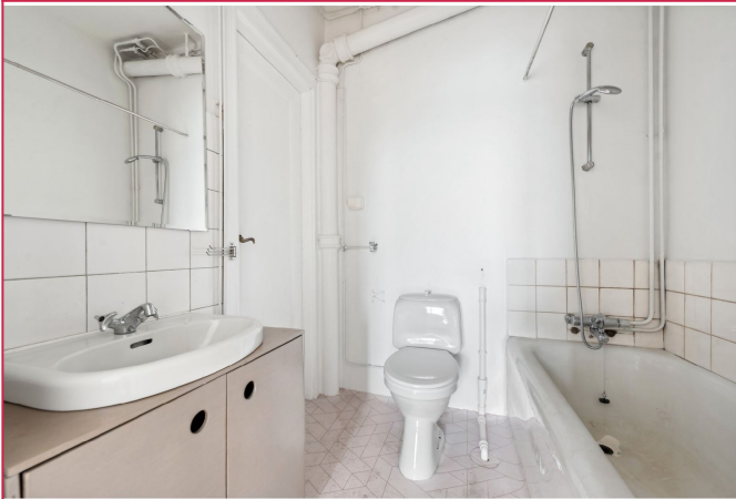
Bad med noe flislagt vegg.