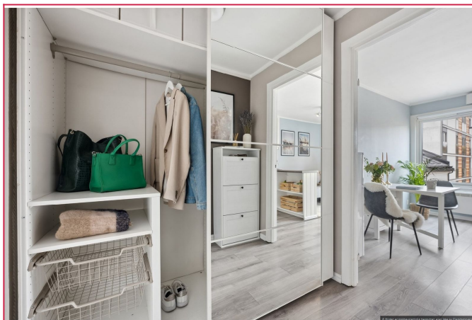
Velkommen inn! Entre med skyvedørgarderobe