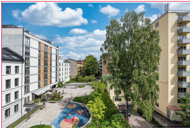
Hyggelig bakgård med grøntarealer