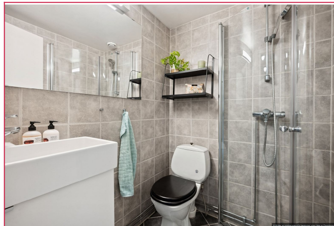
Pent flislagt bad med varmekabler.