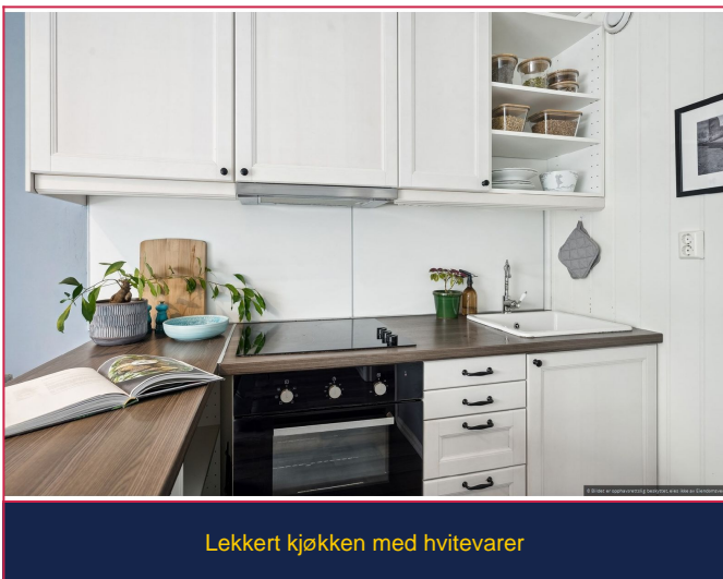
Lekker kjøkken med hvitevarer