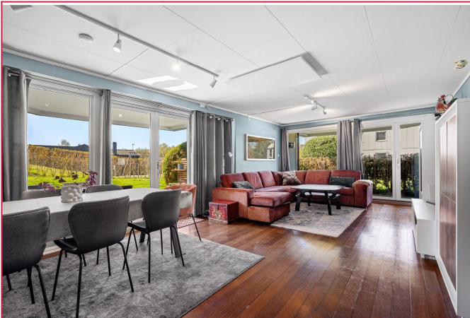
Stuen har to utganger til terrasse / hage