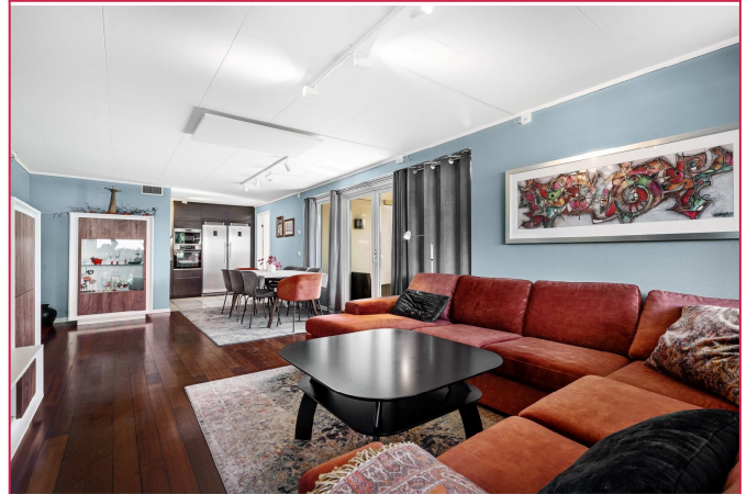
Stue og kjøkken i delvis åpen løsning