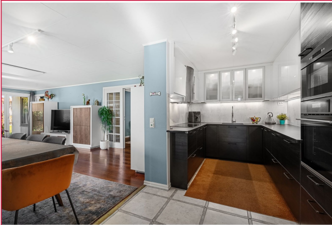
Kjøkkenet har godt med skaplass og alle hvidevarer man trenger