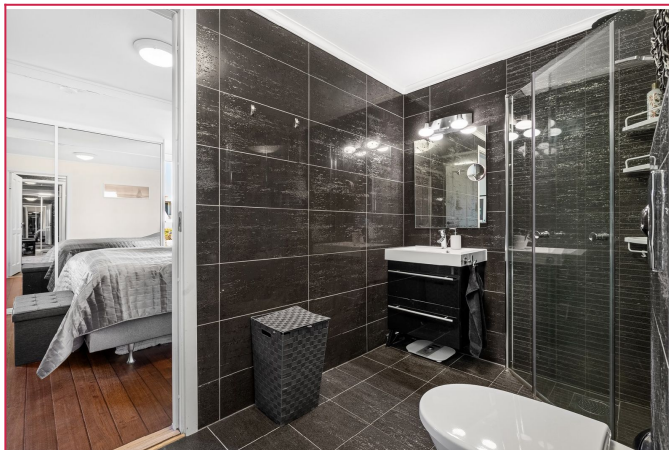
Bad med inngang fra gang og fra soverom