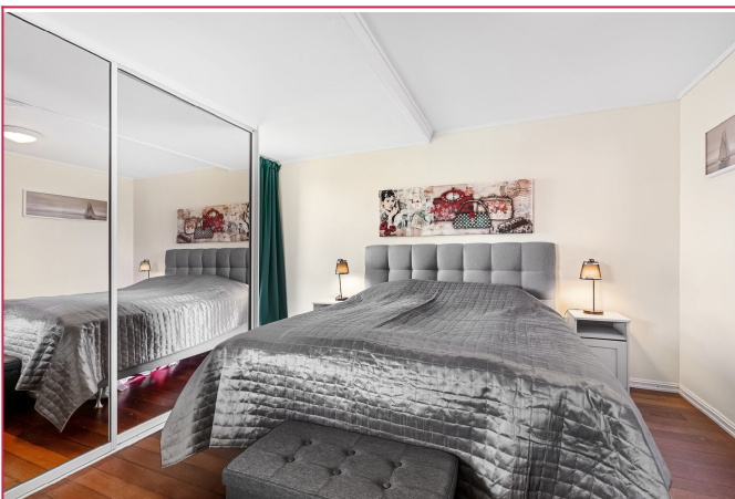
Hovedsoverom med stor garderobe