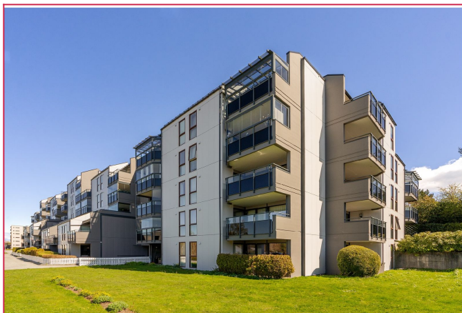
Fine fellesområder for sameiet