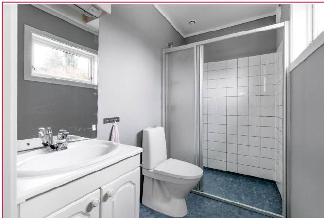
Bad i 1.etg. Dusj og servant m/innredning