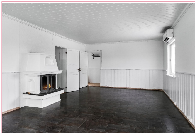
Gode møbleringsmuligheter. Lyst og fint