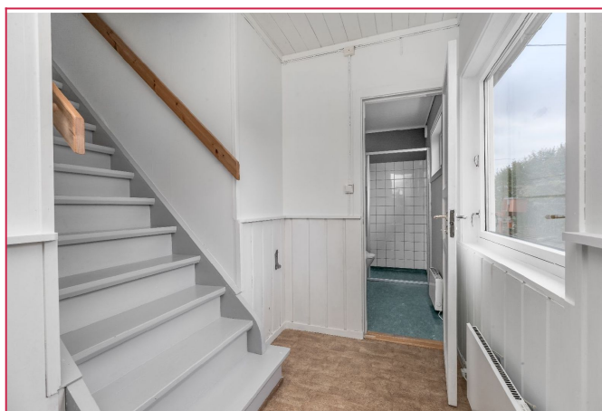
Gang og trappeoppgang