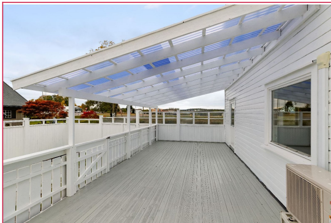
Stor terrasse med plass til hyggelige utemøbler