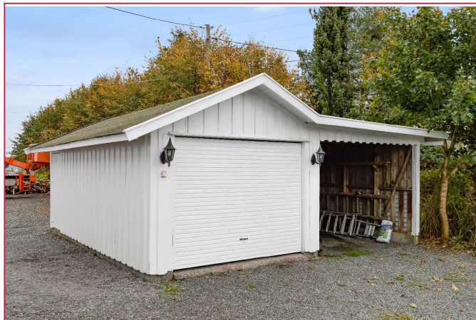
Garasje og carport