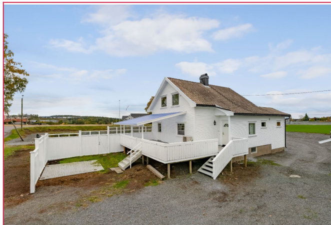
Flott beliggenhet i rolige omgivelser