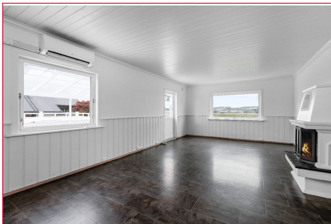
Romslig stue med peisovn og varmepumpe