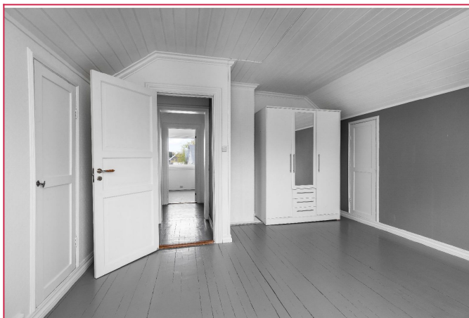
Soverom med garderobeskap