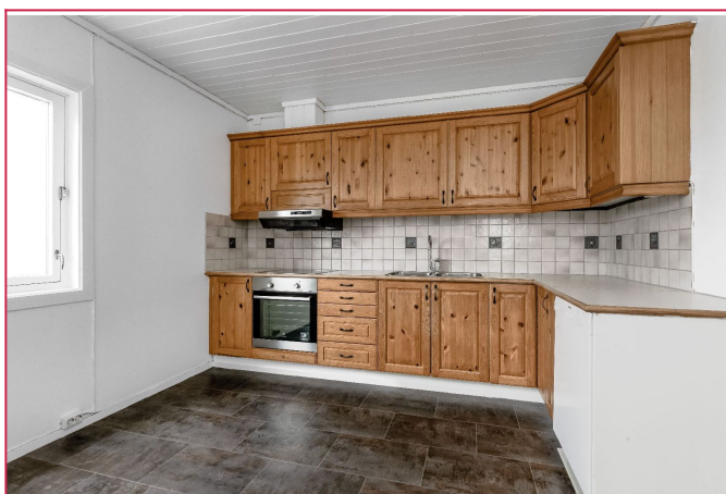
Stort kjøkken med hvitevarer