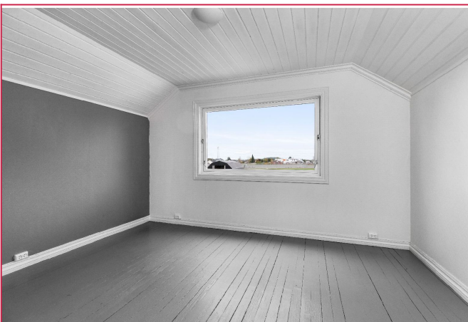
Stort soverom i 2.etg. Plass til dobbeltseng og nattbord