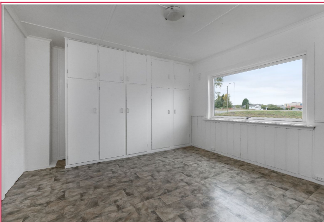
Hovedsoverom i 1.etg. Garderobeskap og stort vindu