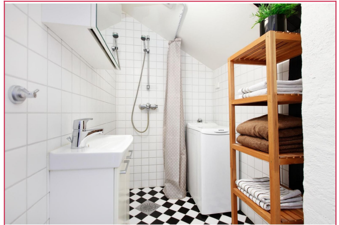
Bad med vaskemaskin.