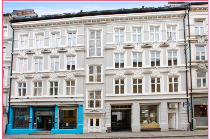
Fasade. Leiligheten er i byggets toppetasje og er på over to plan.