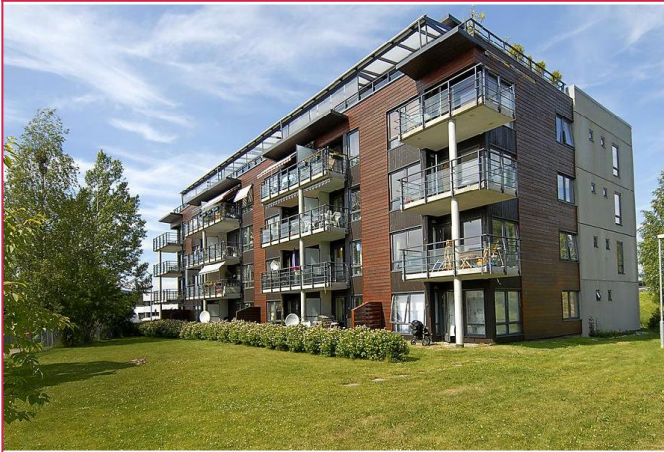
Fasade - Garasjeplass er inkludert i leien -