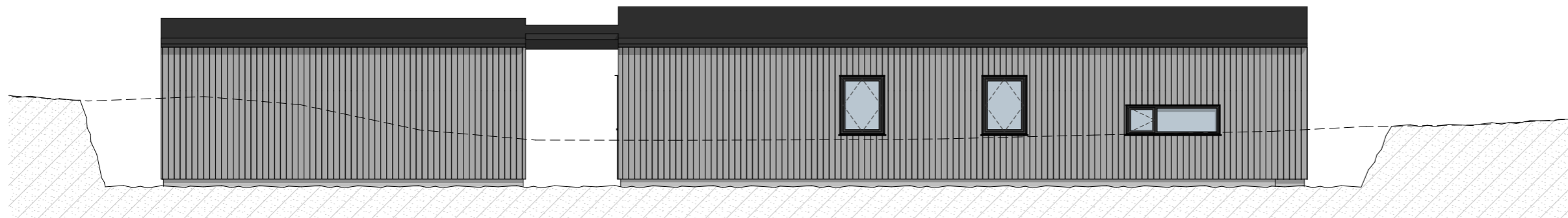
1:100 M8 Fasade Nord