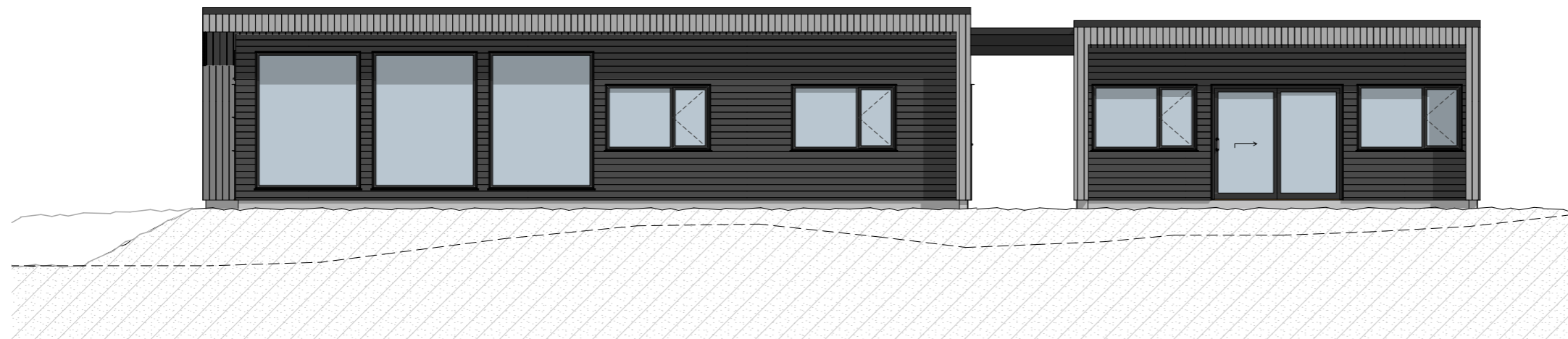
1:100 M8 Fasade Sør