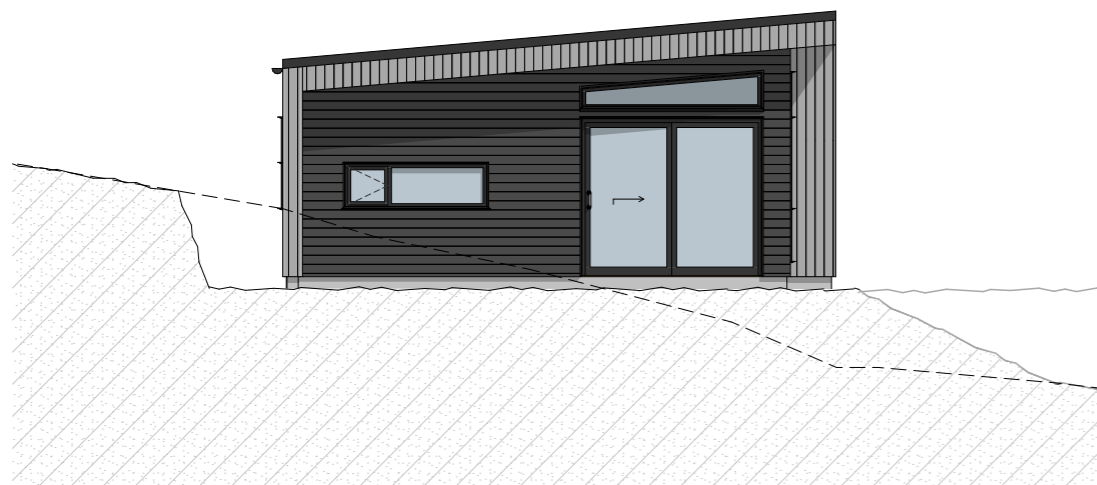
1:100 M8 Fasade Vest