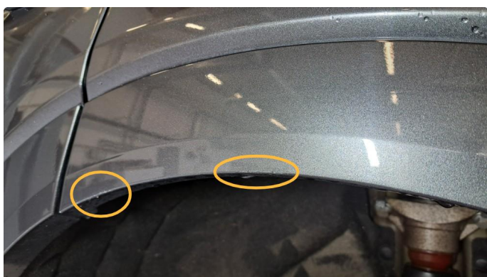
1.1 Riper i hjulbuelist.