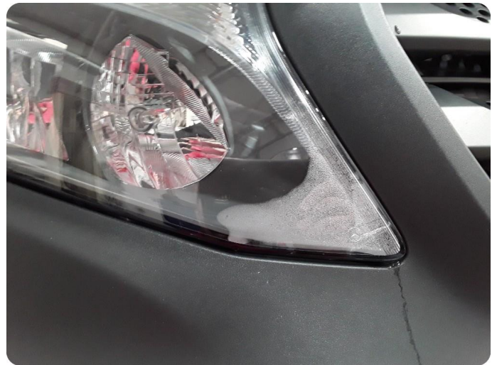
3.1 Dugg/fukt Trenger feilsøk