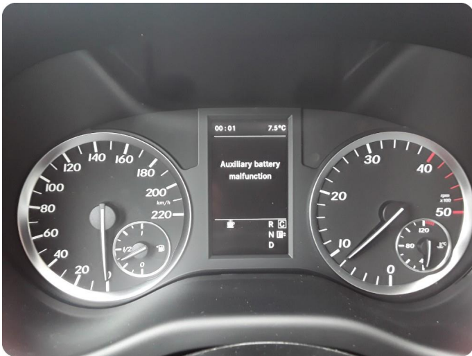
1.1 Varsellampe lyser se bilde Trenger feilsøk