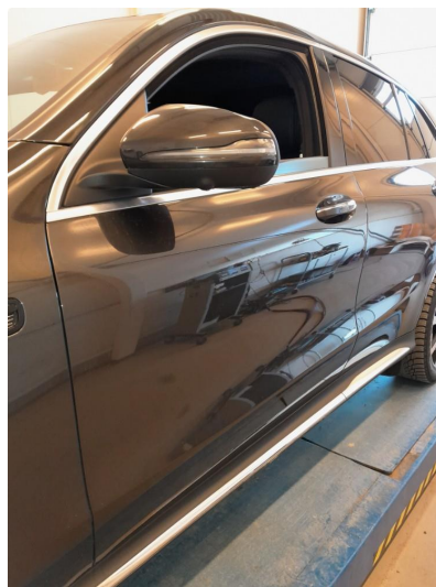
1.2 Normal bruksmerke på døra