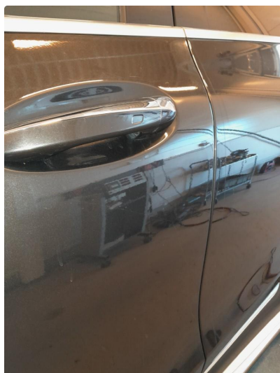
1.2 Normal bruksmerke på døra