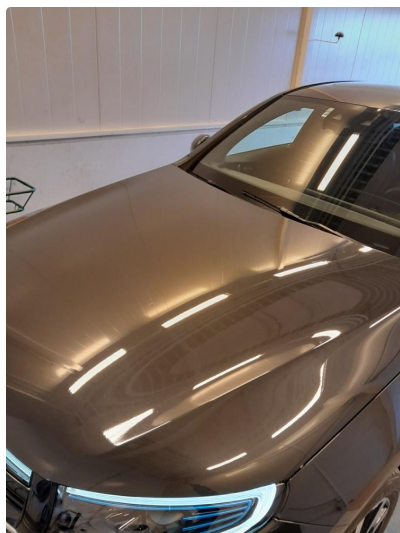
1.1 Flekket med lakkstift