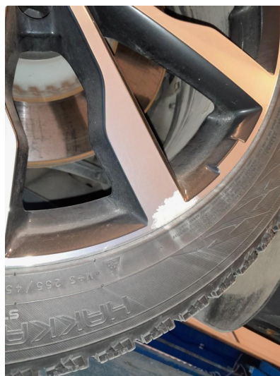
1.3 Normal bruksmerke på felgen.