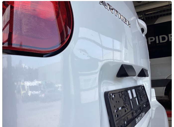
1.3 Bulk med lakkskade