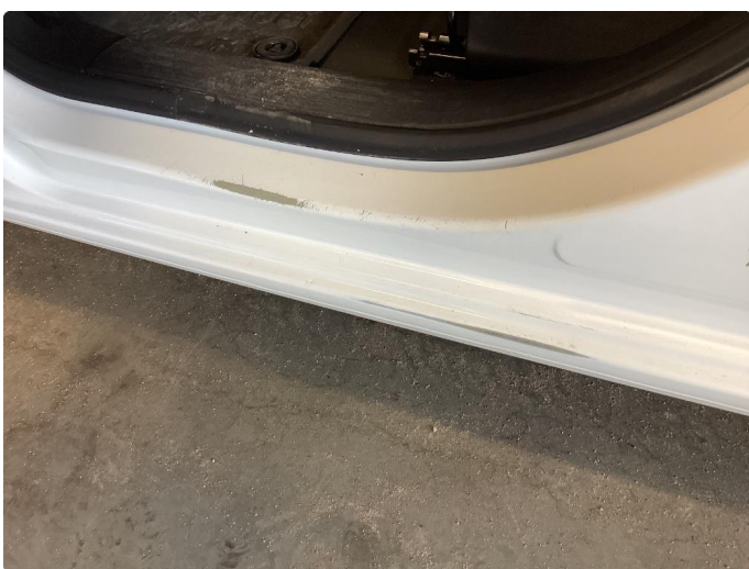
1.4 Slitt innsteg