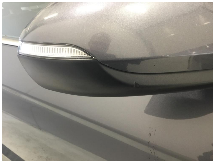
1.5 Speilhus skadet