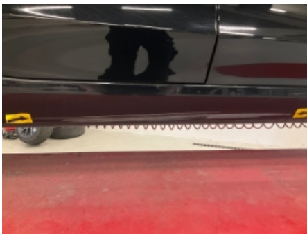
16. Lakk / karosseri utvendig