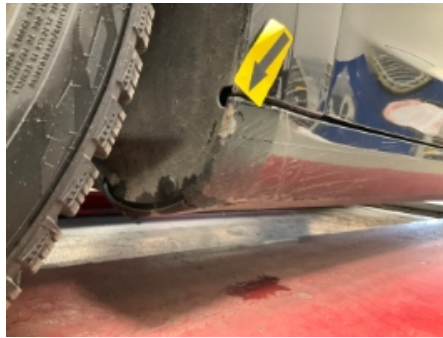
14. Lakk / karosseri utvendig