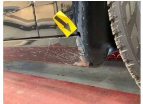
15. Lakk / karosseri utvendig