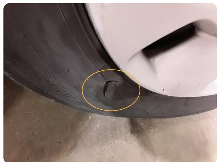
2.7 Dekkskade vinterhjul -ett stk