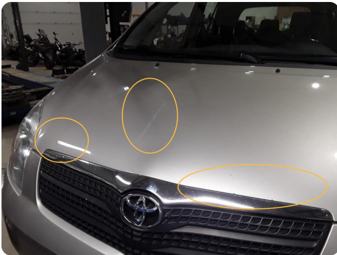
2.1 Steinsprut /ink med rust og riper