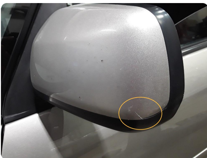
2.5 Speilhus skadet