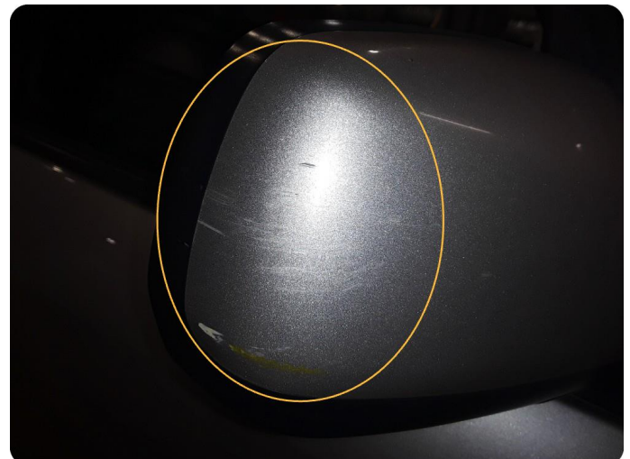
2.4 Speilhus riper