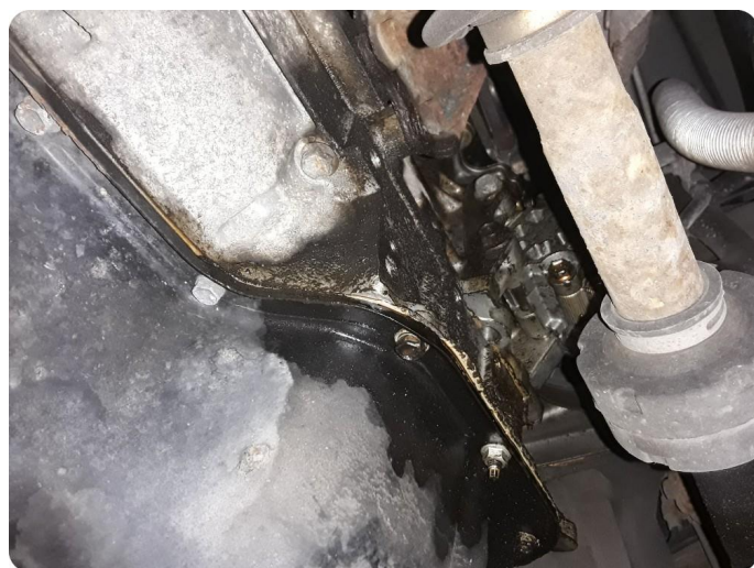
3.1 Oljelekkasje fra motor Trenger feilsøk