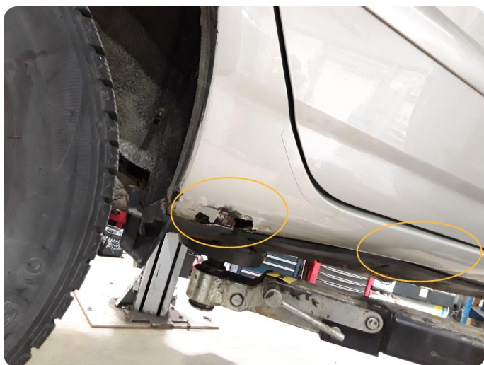
2.10 Rusthull - ink bulker