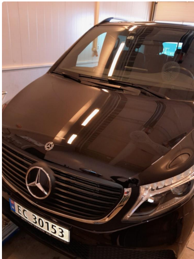
1.1 Flekket med lakkstift.