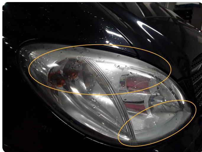
4.2 Matte glass -og vann i lykter