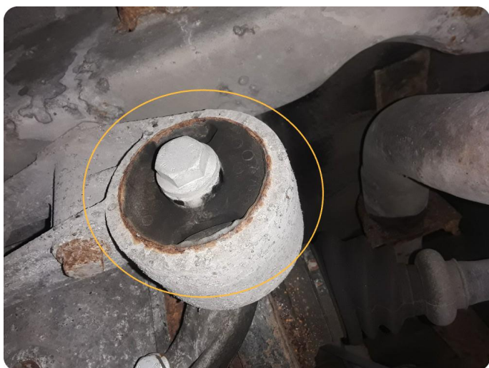
7.3 Øvrige feil Slitte opphengsforinger