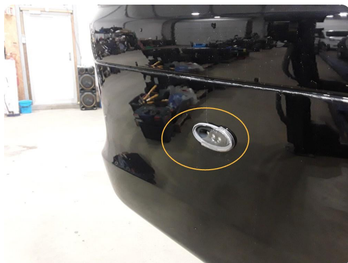
4.4 Krakelering i plast /sprukket glass