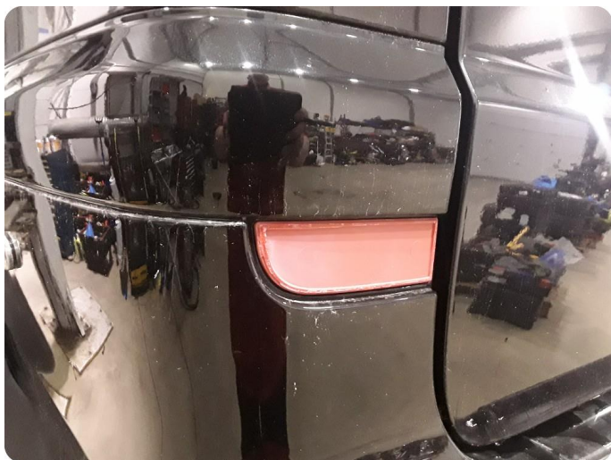
3.10 Skade /skadet refleks