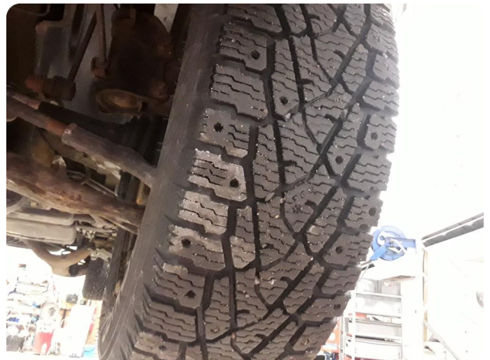
3.6 Piggdekk mangler pigger -i alle dekk