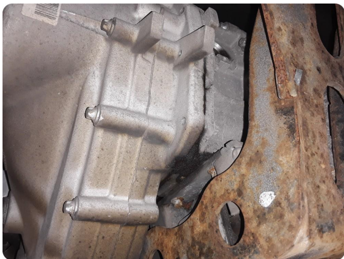
7.1 Svetter Trenger feilsøk