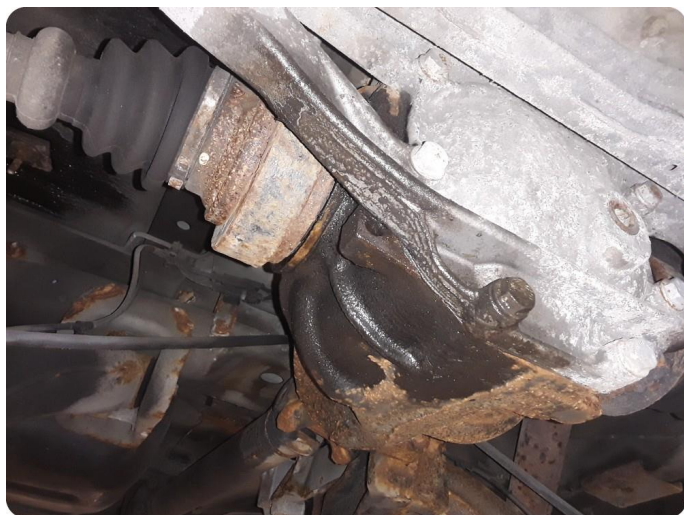
7.2 Lekkasje Trenger feilsøk