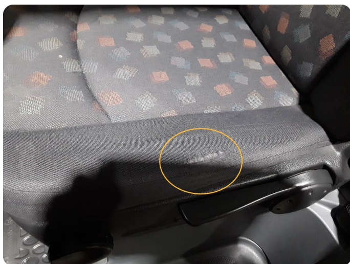
8.1 Skade på setetrekk