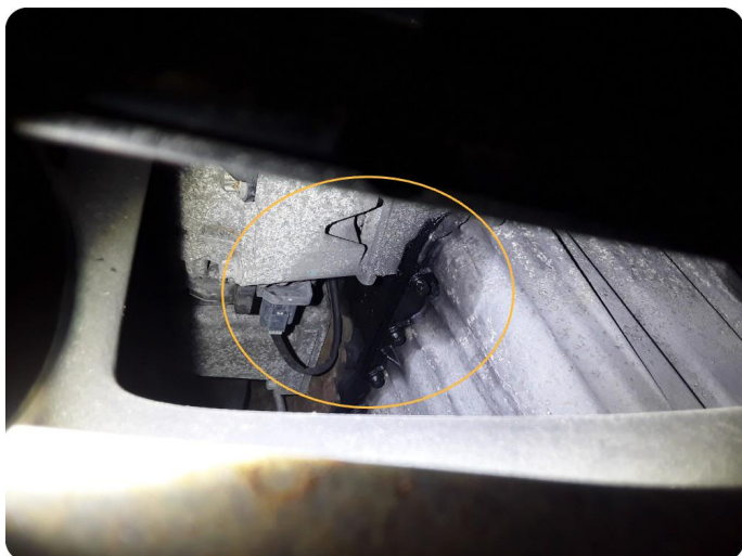
5.1 Oljelekkasje fra motor