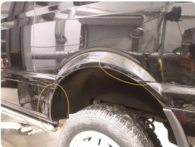
3.4 Rust -ink riper venstre bak