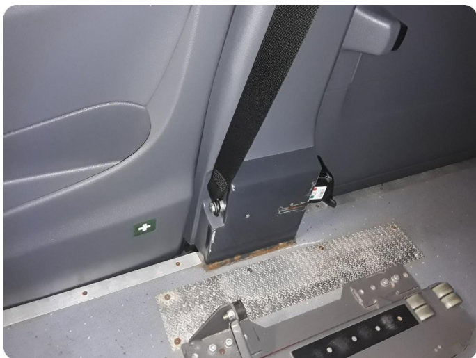
9.1 Øvrig opplysninger B-stolpe må bygges om til org tilstand av et godkjent verksted. Deretter må det godkjennes av SVV.