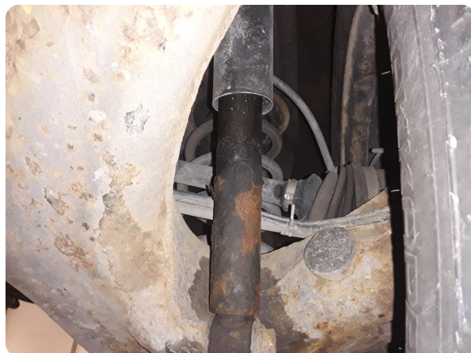
6.1 Støtdemper lekkasje