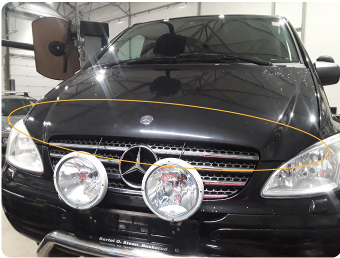
3.2 Steinsprut /med rust