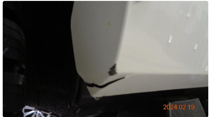
1.1 Sprekk nedre dørdeksel høyre bakdør - byttes