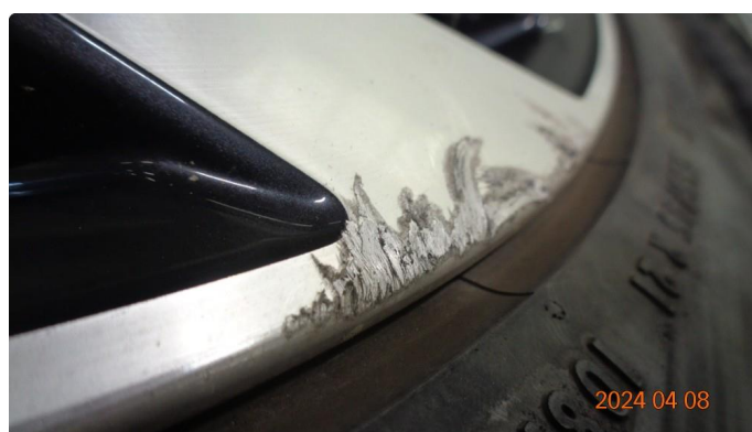
1.3 Kantkjørte sommerfelger - 3 byttes