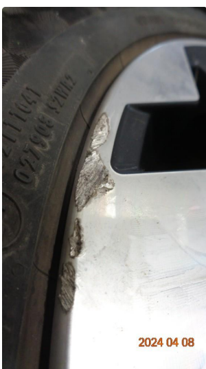
1.3 Kantkjørte sommerfelger - 3 byttes