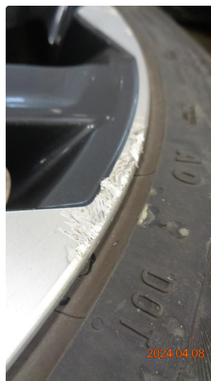
1.3 Kantkjørte sommerfelger - 3 byttes