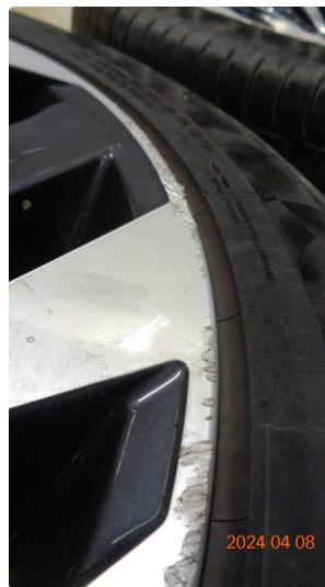
1.3 Kantkjørte sommerfelger - 3 byttes