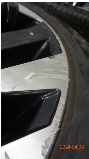
1.3 Kantkjørte sommerfelger - 3 byttes