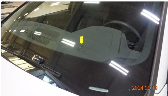
1.4 Steinsprut frontrute - repareres