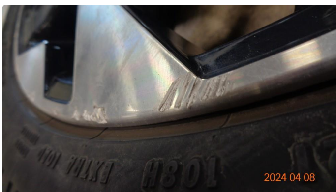
1.3 Kantkjørte sommerfelger - 3 byttes