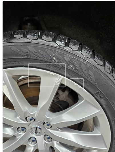
2.1 Skrubbermerker på en vinterfelg