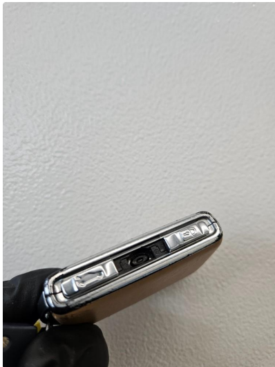
1.1 Reservenøkkel mangler "lås-opp-knapp", bilen er "nøkkelløs" så ingen praktisk betydning for bruk