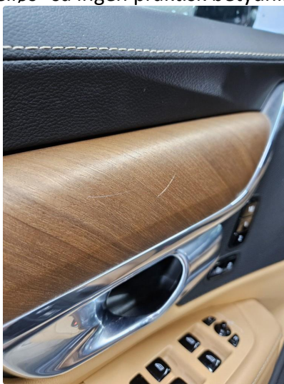
3.1 Liten ripe