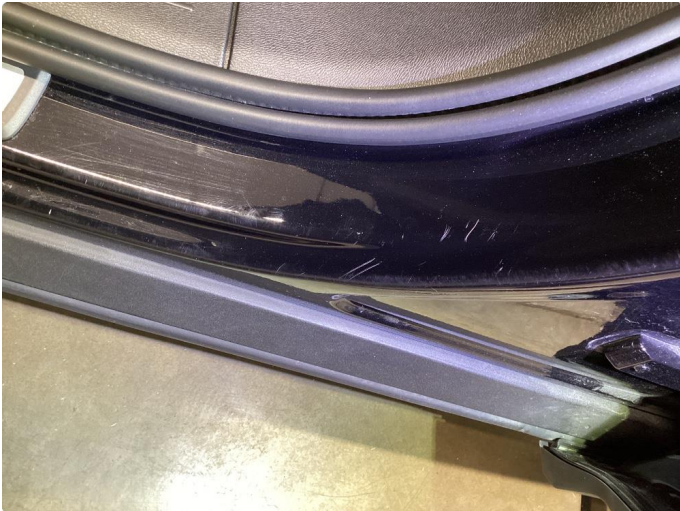
1.1 Normal slitaje