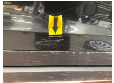
18. Lakk / karosseri utvendig