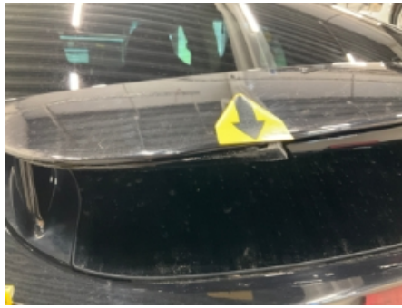
26. Lakk / karosseri utvendig