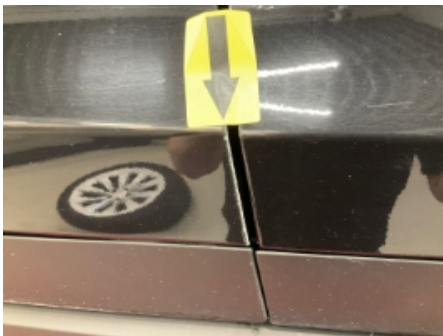
19. Lakk / karosseri utvendig