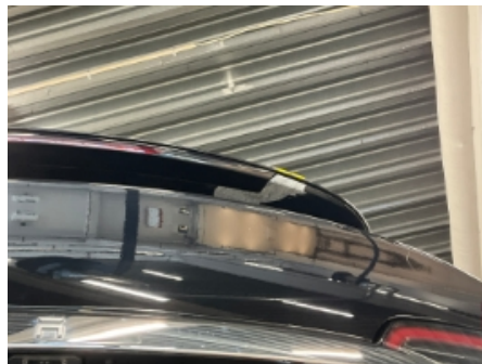
20. Lakk / karosseri utvendig