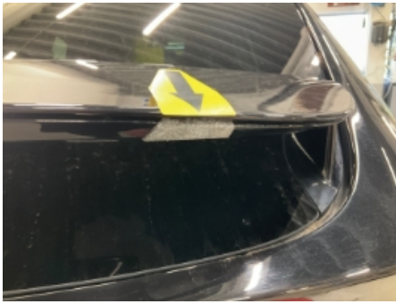
25. Lakk / karosseri utvendig