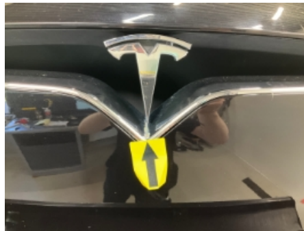
17. Lakk / karosseri utvendig