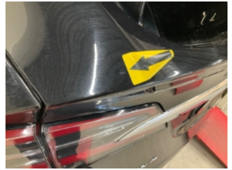
27. Lakk / karosseri utvendig