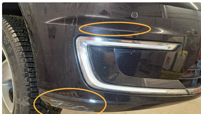
1.1 Steinsprut panser, lakksår v. bakdør, skaperer på støtfanger h.f.