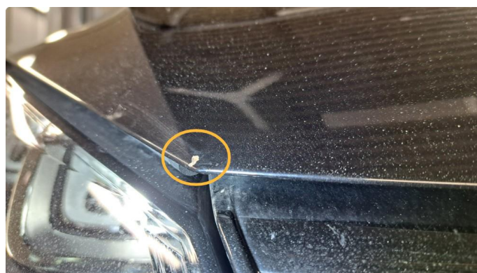
1.1 Steinsprut panser, lakksår v. bakdør, skaperer på støtfanger h.f.