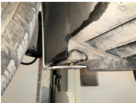
28. Vindusvisker, spylar (foran/bak)