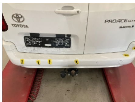
35. Støtfanger bak