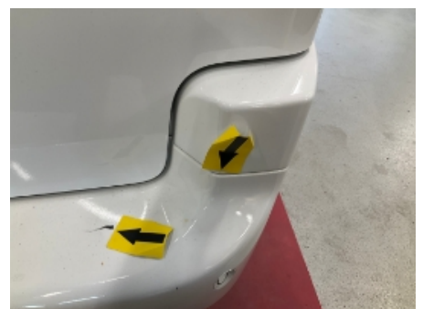
36. Venstre baksjerm