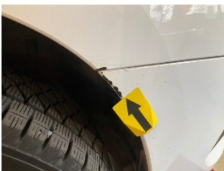
34. Støtfanger foran