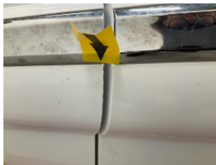
32. Venstre fordør