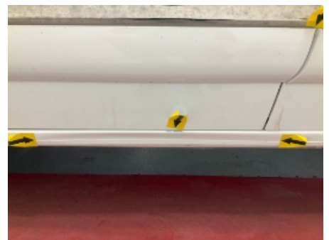
33. Venstre kanal