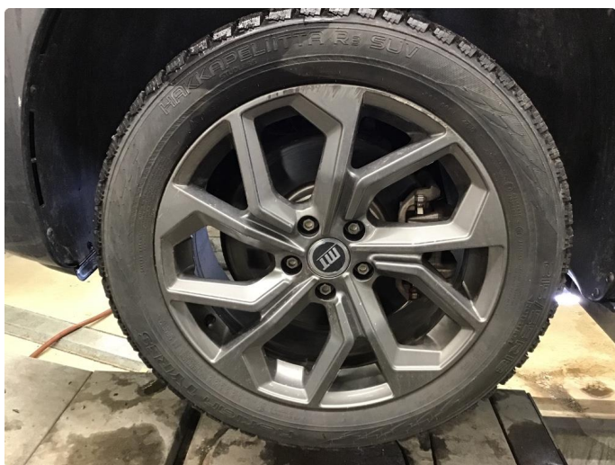
1.3 Kantkjørt felg