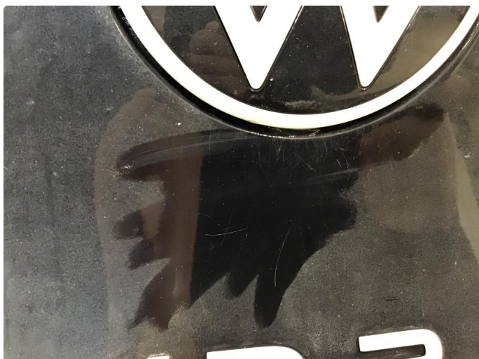
1.1 Noen riper