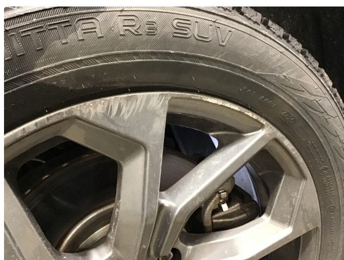
1.3 Kantkjørt felg