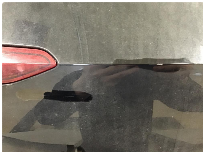
1.1 Noen riper