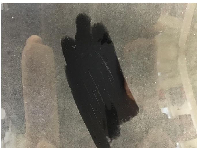
1.1 Noen riper