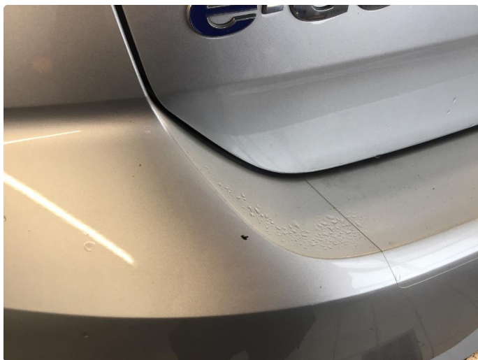
1.7 Skrubbmerke støtfanger. kosmetisk betydning