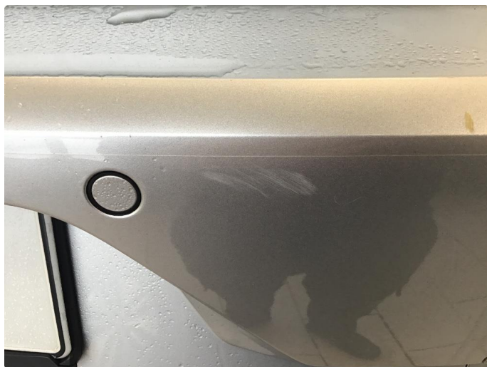
1.7 Skrubbmerke støtfanger. kosmetisk betydning