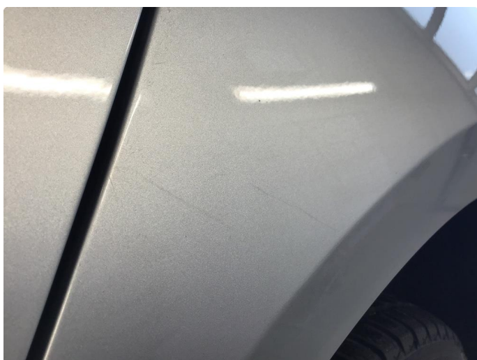
1.4 Bruksmerker skjerm.