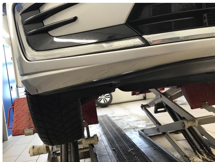
1.6 Lite skrubbermerke under støtfanger foran