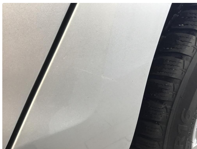
1.4 Bruksmerker skjerm.