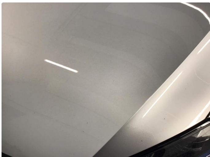
1.1 Steinsprut/bruksmerke panser