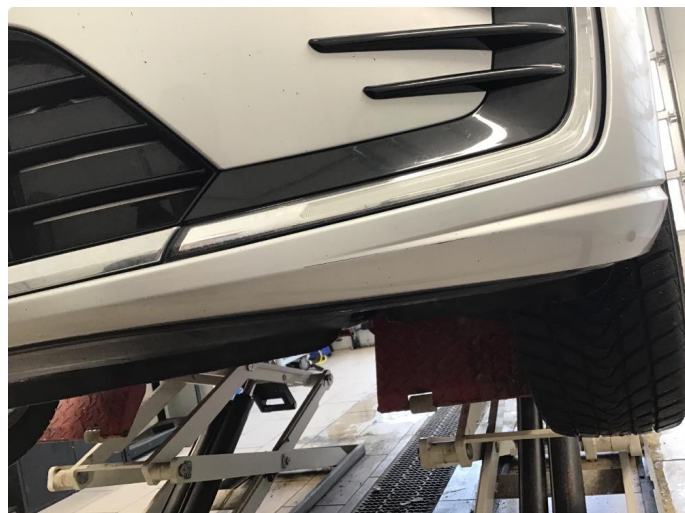
1.6 Lite skrubbermerke under støtfanger foran