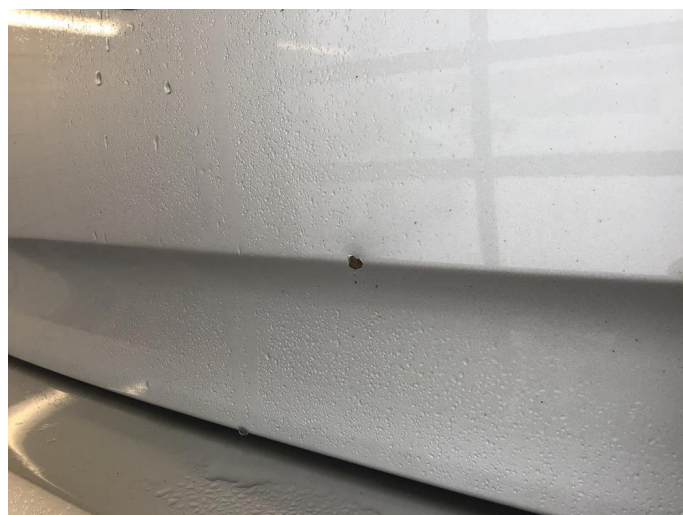
1.3 Steinsprang bakluke