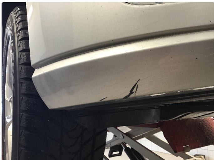
1.6 Lite skrubbermerke under støtfanger foran