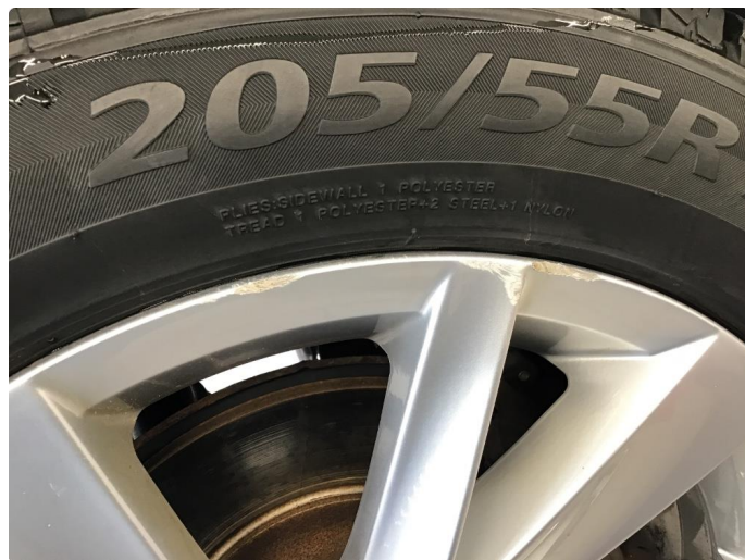
1.5 Merke på felg