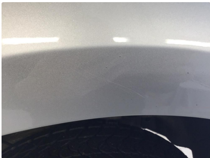
1.4 Bruksmerker skjerm.