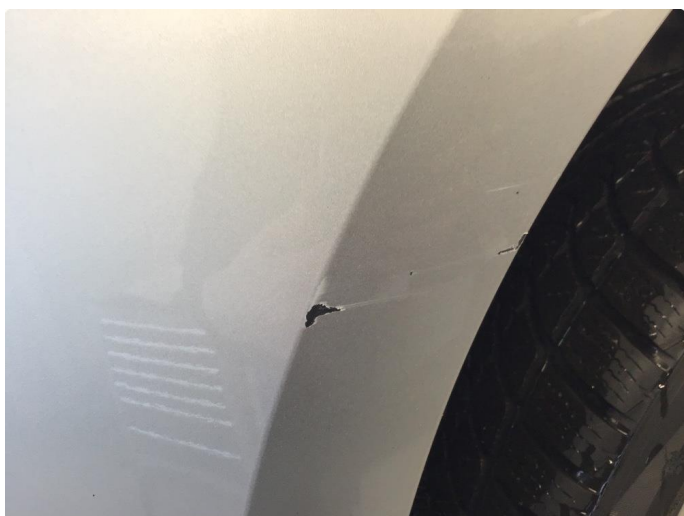
1.7 Skrubbmerke støtfanger. kosmetisk betydning