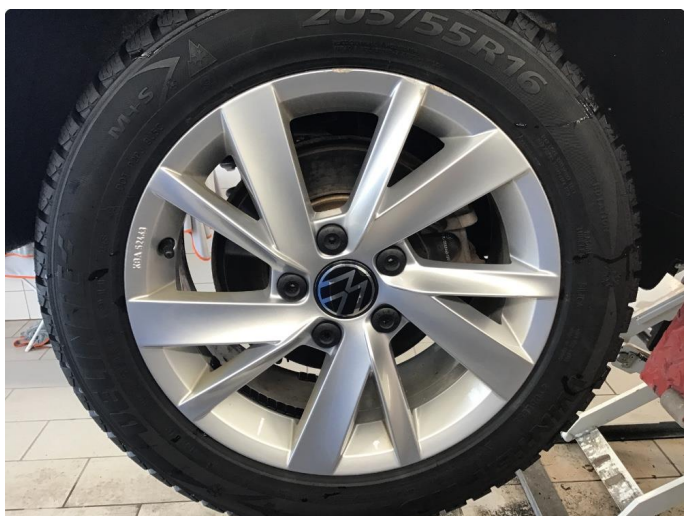
1.5 Merke på felg