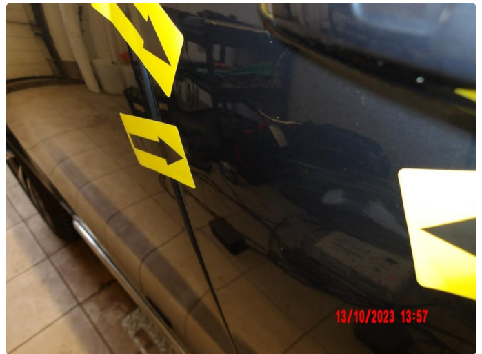
1.1 Flere p-bulker