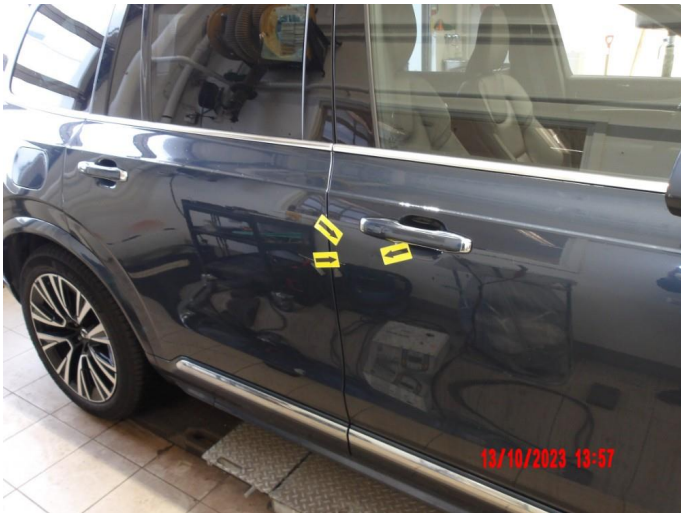
1.1 Flere p-bulker