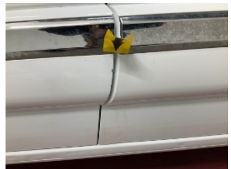
18. Venstre fordør