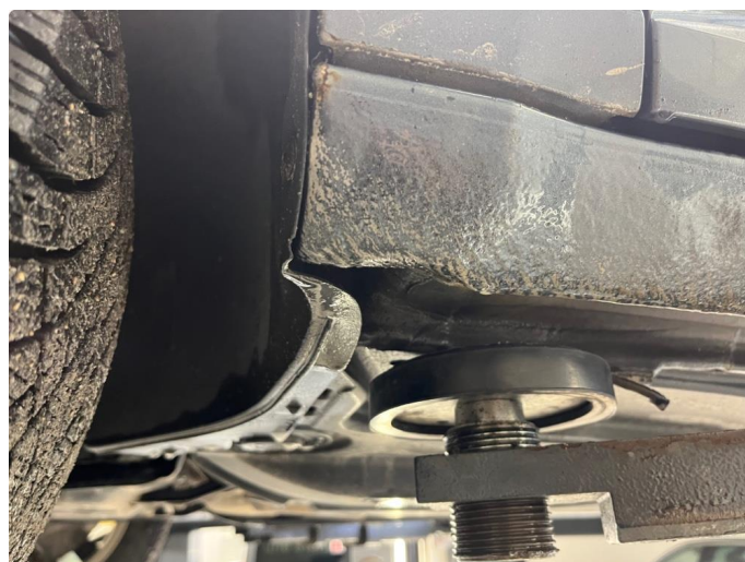
1.2 Noe kosmetisk nederst på framskjerm høyre side foran.