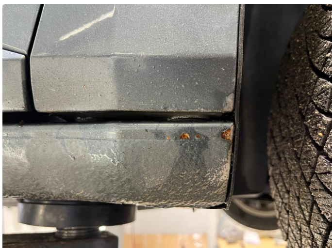
1.1 Noe kosmetisk nederst på framskjerm venstre side foran.