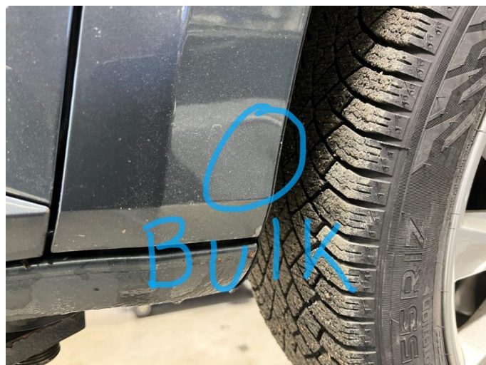
1.1 Noe kosmetisk nederst på framskjerm venstre side foran.