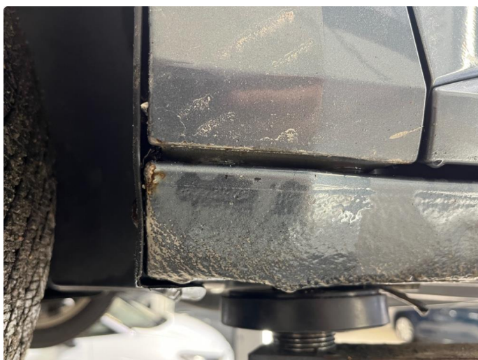
1.1 Noe kosmetisk nederst på framskjerm venstre side foran.