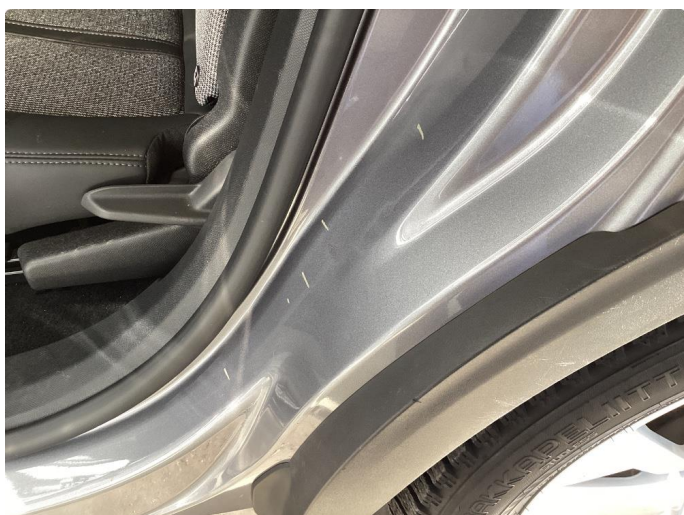
1.3 Bulk(er) med lakkskade