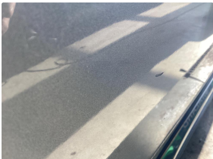
1.1 Bulk med lakkskade