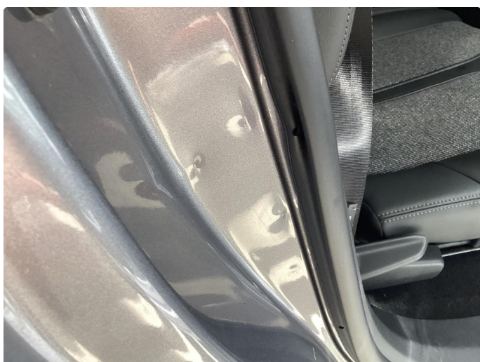
1.3 Bulk(er) med lakkskade