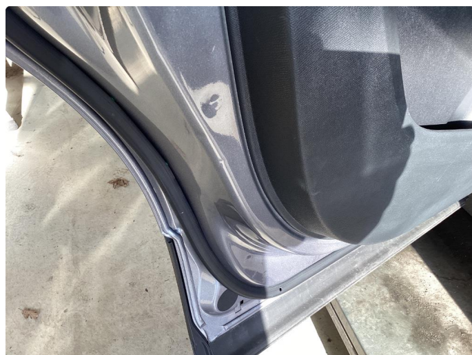
1.3 Bulk(er) med lakkskade