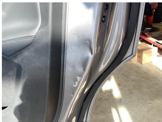
1.3 Bulk(er) med lakkskade