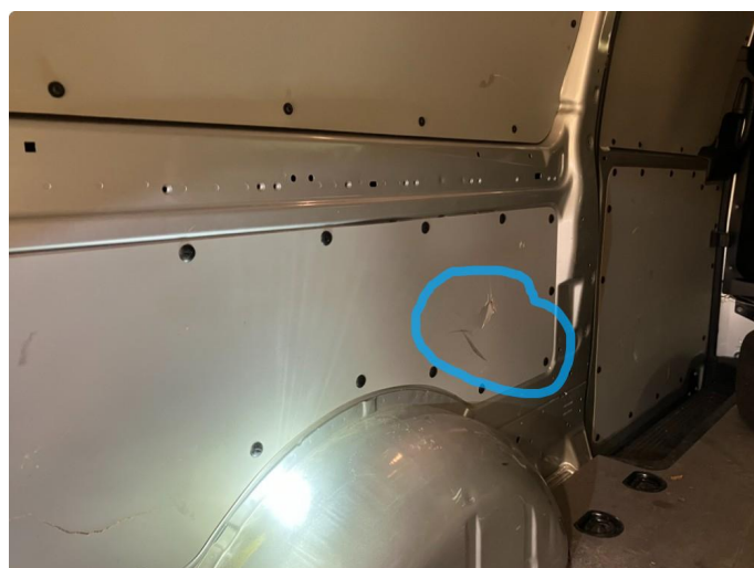
2.1 2 nye plater er bestilt: 1 til bakluken og 1 til siden. Platene er restet så det blir utbedret så raskt vi får tilgang på dem.