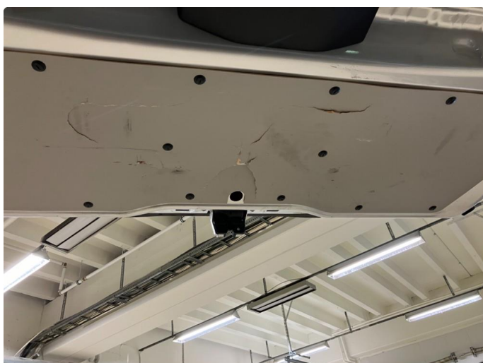
2.1 2 nye plater er bestilt: 1 til bakluken og 1 til siden. Platene er restet så det blir utbedret så raskt vi får tilgang på dem.