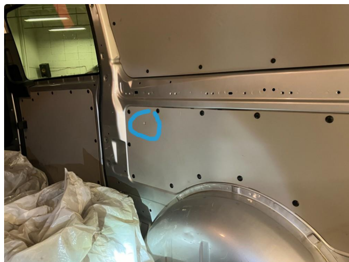
2.1 2 nye plater er bestilt: 1 til bakluken og 1 til siden. Platene er restet så det blir utbedret så raskt vi får tilgang på dem.