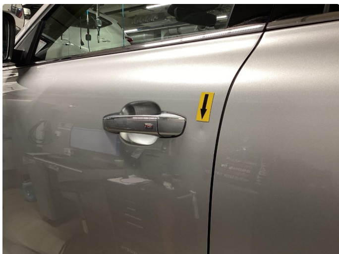
1.1 Liten p-bulk