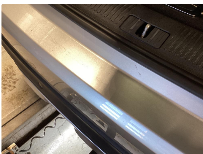
1.4 Små ripe(r)