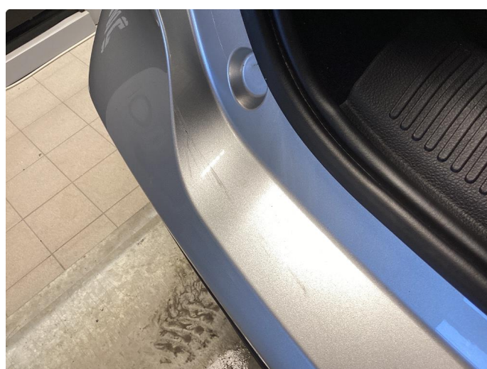
1.4 Små ripe(r)