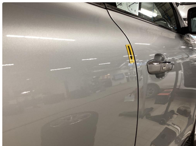
1.2 Liten bulk