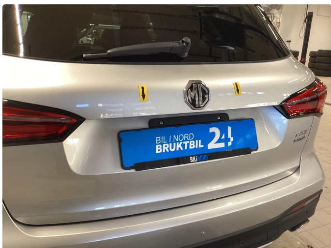
1.3 Liten bulk