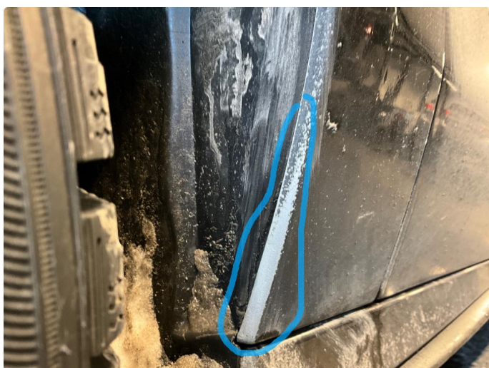
1.3 Slitt lakk i i hjulbue mot førerdør.