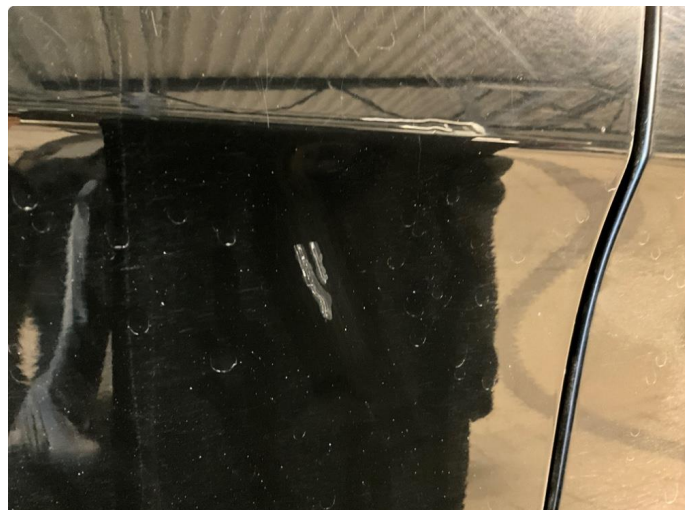
1.1 Ripe på dør. Venstre foran.