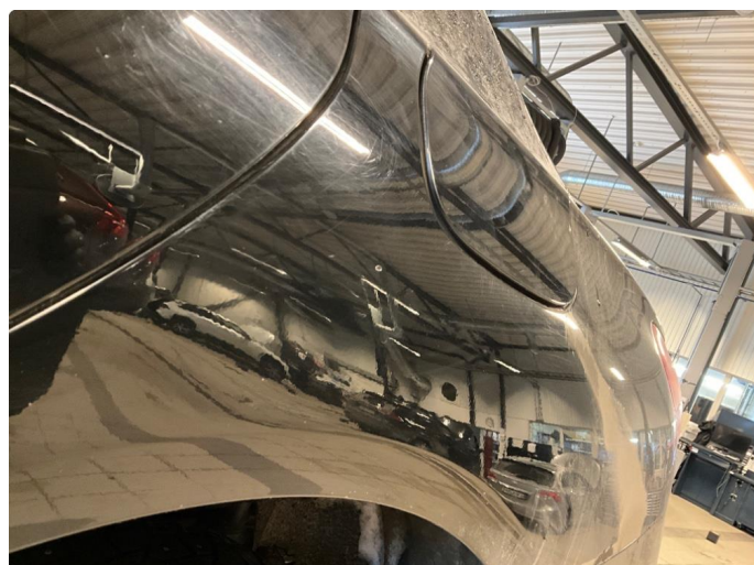
1.2 En liten bulk på skjerm. Venstre side bak.