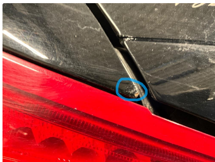
1.4 Noe rustbobler på skjerm over lykt. Venstre bak.