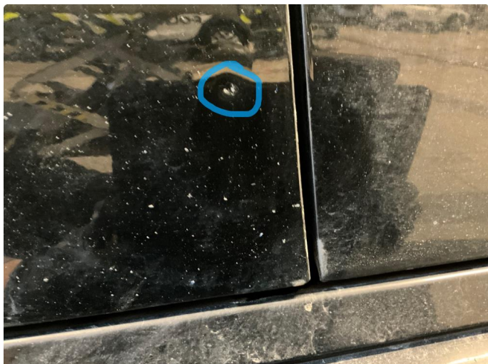
1.1 Ripe på dør. Venstre foran.