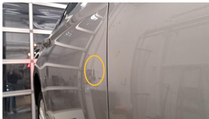
1.2 Flere p-bulker