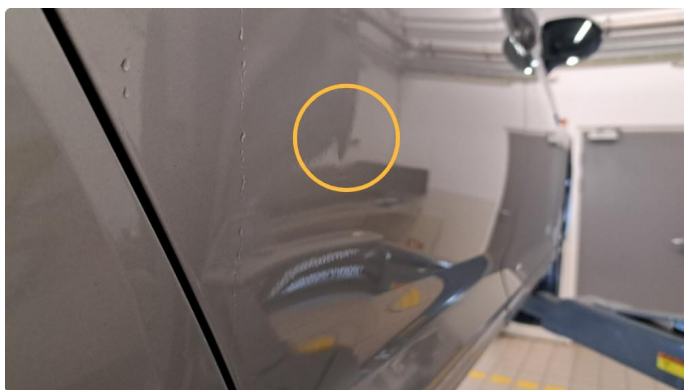
1.2 Flere p-bulker