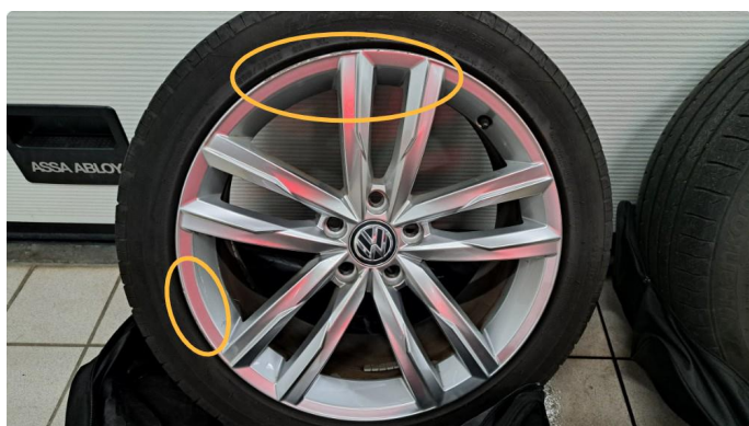
1.7 Kantkjørt felg. 2 stk sommerfelger.