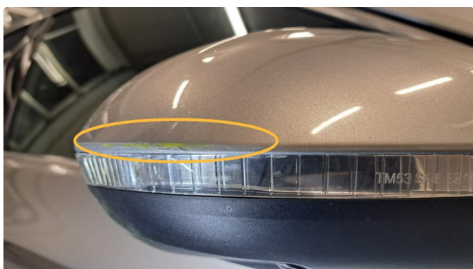
1.6 Riper i speilhus begge sider.