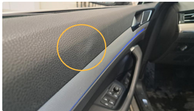
2.1 Bulk i polstring.