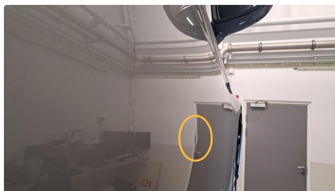
1.2 Flere p-bulker