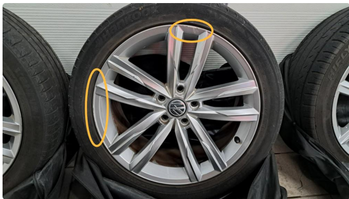
1.7 Kantkjørt felg. 2 stk sommerfelger.