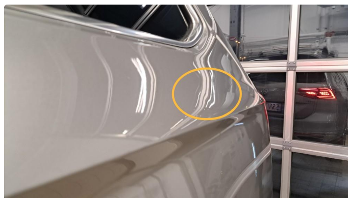
1.4 Bulk med lakkskade.