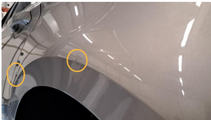
1.4 Bulk med lakkskade.