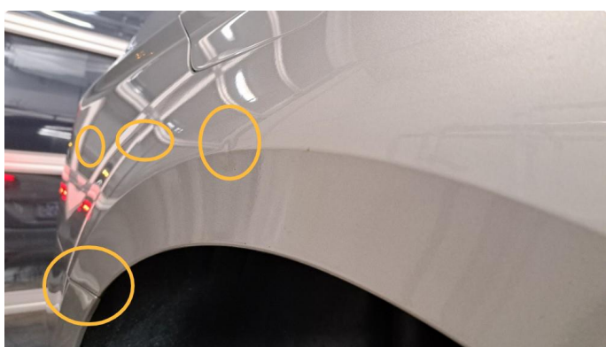
1.5 Påbegynt rust og småbulker.