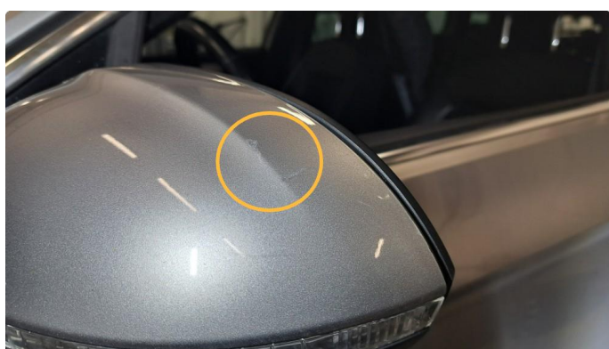
1.6 Riper i speilhus begge sider.