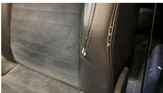
2.2 Skade på setetrek