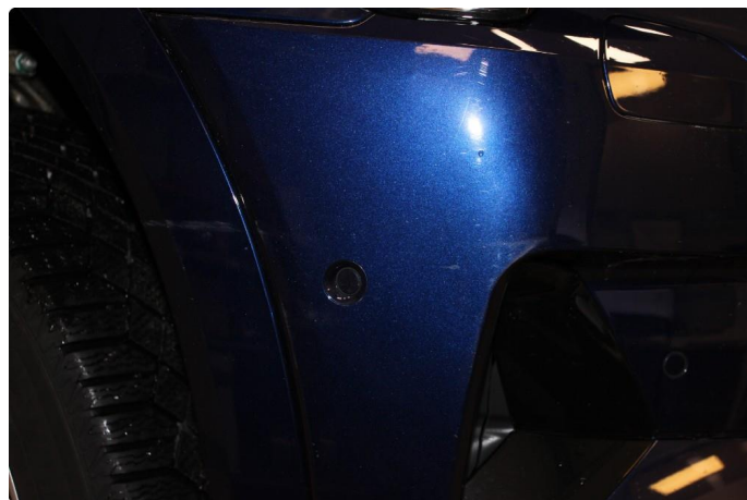
1.2 Noen små riper på hjulbue. Er rubbet og polert.