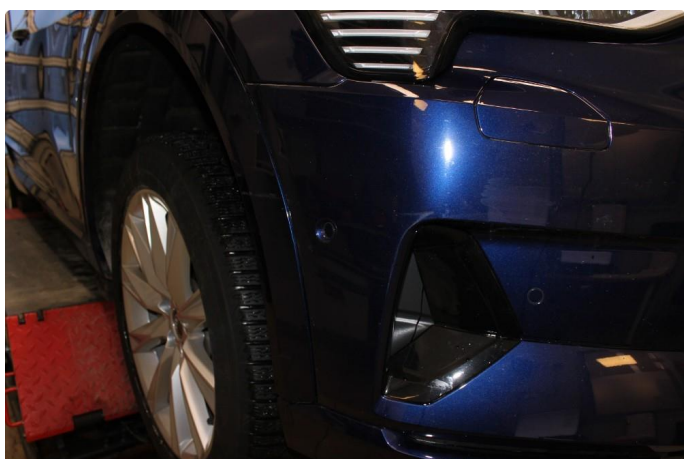
1.2 Noen små riper på hjulbue. Er rubbet og polert.