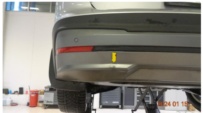
1.3 Bulk med lakkskade diffusor i støtfanger bak - utbedres