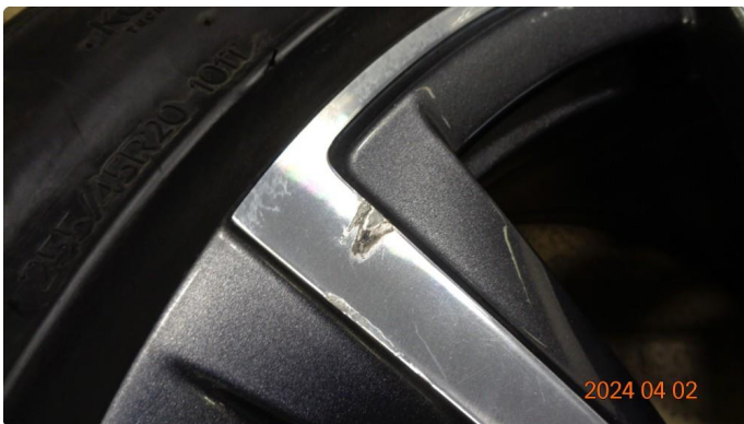
1.2 Kantkjørt sommerfelg