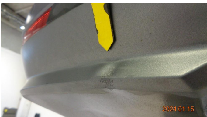
1.3 Bulk med lakkskade diffusor i støtfanger bak - utbedres