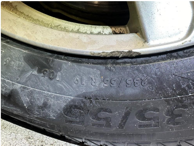
1.1 Kantkjørt vinterfelg