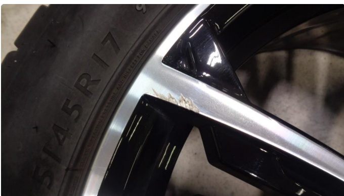
1.4 Kosmetiske skader på 1stk sommerfelg -