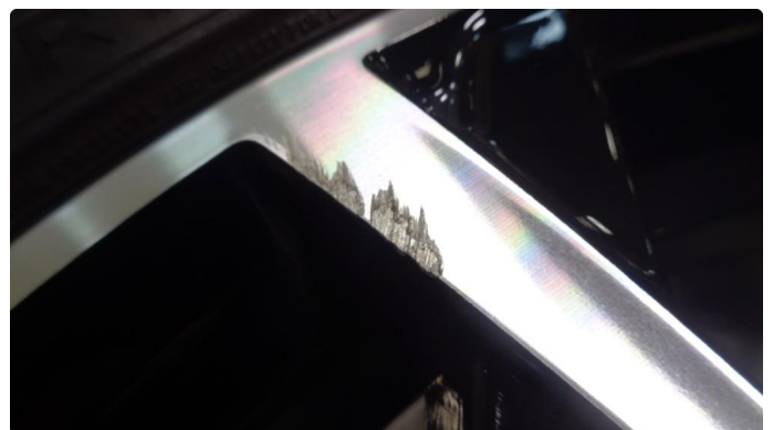
1.4 Kosmetiske skader på 1stk sommerfelg -