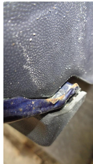
1.3 Lakkrust venstre hjulbue bak.