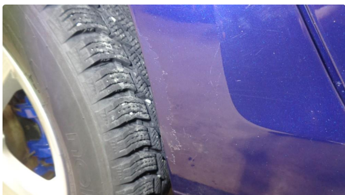
1.2 Lakkflass (klarlakk) og rust høyre hjulbue bak.