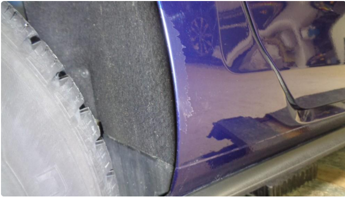
1.2 Lakklass (klarlakk) og rust høyre hjulbue bak.