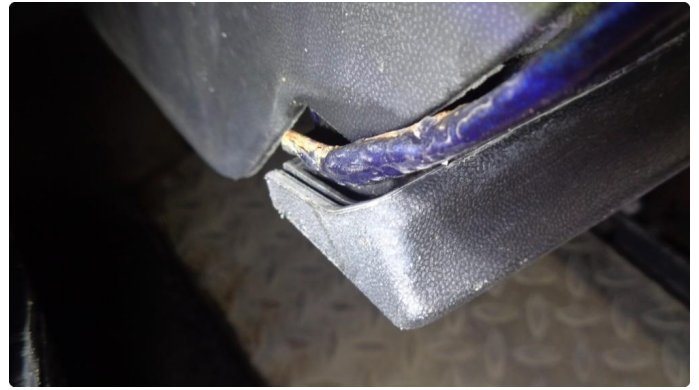
1.2 Lakklass (klarlakk) og rust høyre hjulbue bak.