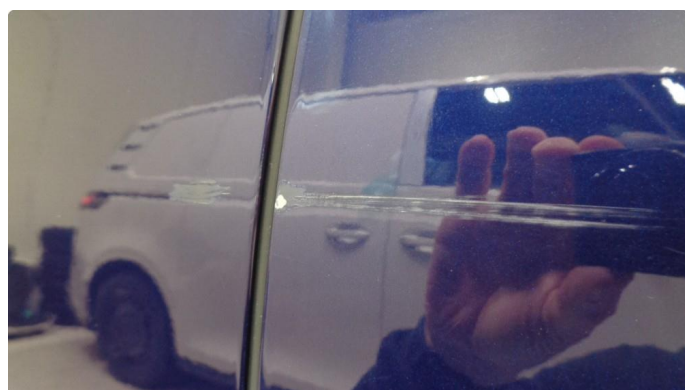
1.1 Ripe gjennom lakk venstre for- og bakdør.