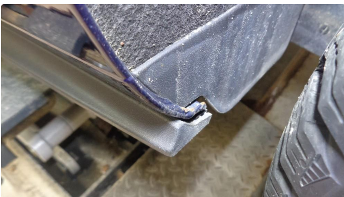
1.3 Lakkrust venstre hjulbue bak.