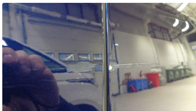
1.1 Ripe gjennom lakk venstre for- og bakdør.