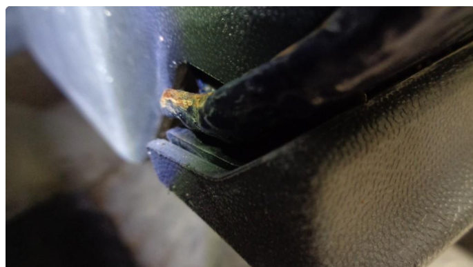
1.2 Lakkflass (klarlakk) og rust høyre hjulbue bak.